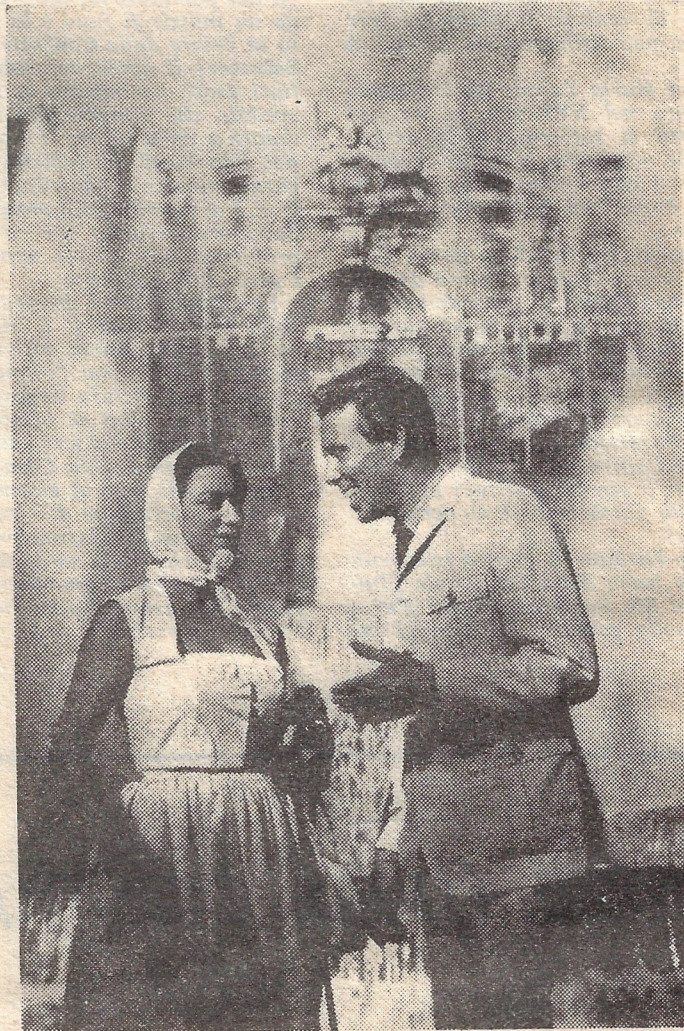
La principessa Margaret e Tony Armstrong a Villa d'Este

Scuola di Litografia Villaggio Don Bosco - Tivoli