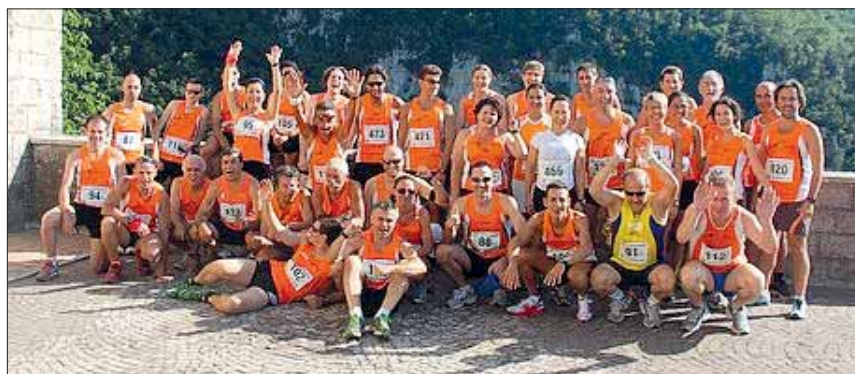
Gli Orange alla "Jennesina".

Campotosto, un nome e un programma. E il primo Giro del Lago di Campotosto non poteva che riflettere il carattere della gente, una gara per gente gajarda e tosta . 24 chilometri (che la notte prima della gara si trasformano magicamente in 25.2), non sono distanze per tutti, ci vuole in