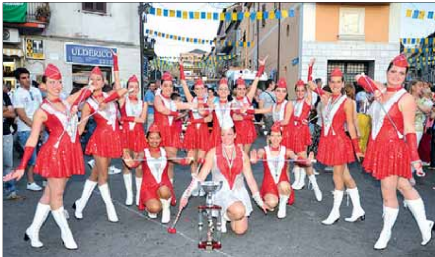
Faleria, 24 giugno 2012. Le majorettes di Sant'Angelo Romano, con la coppa del 2° posto.