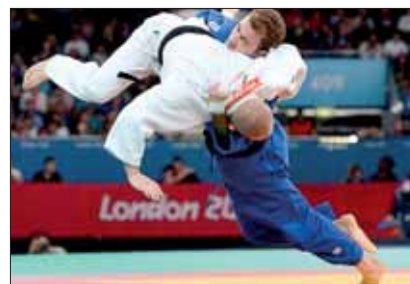
Due atleti non vedenti di Judo in combattimento nelle Paralimpiadi.