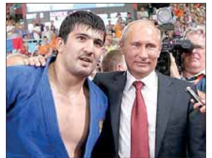
Putin, cintura nera di Judo, con un atleta russo medaglia d'oro.