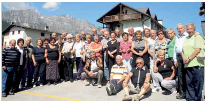
Il gruppo dei partecipanti al soggiorno in posa all'esterno dell'hotel con vista panoramica.

Dall'alto: escursione a Spormaggiore con il gruppo in posa sotto la Madonna di Lourdes; la cappella in quota 1.200 dedicata alla madonna di Loreto (AN); particolare dei Presepi nella «mostra permanente» al Centro Sportivo; visita all'Azienda vinicola «Rotari» a Mezzocorona; in posa davanti alla Chiesa S. Maria Assunta di Spormaggiore.