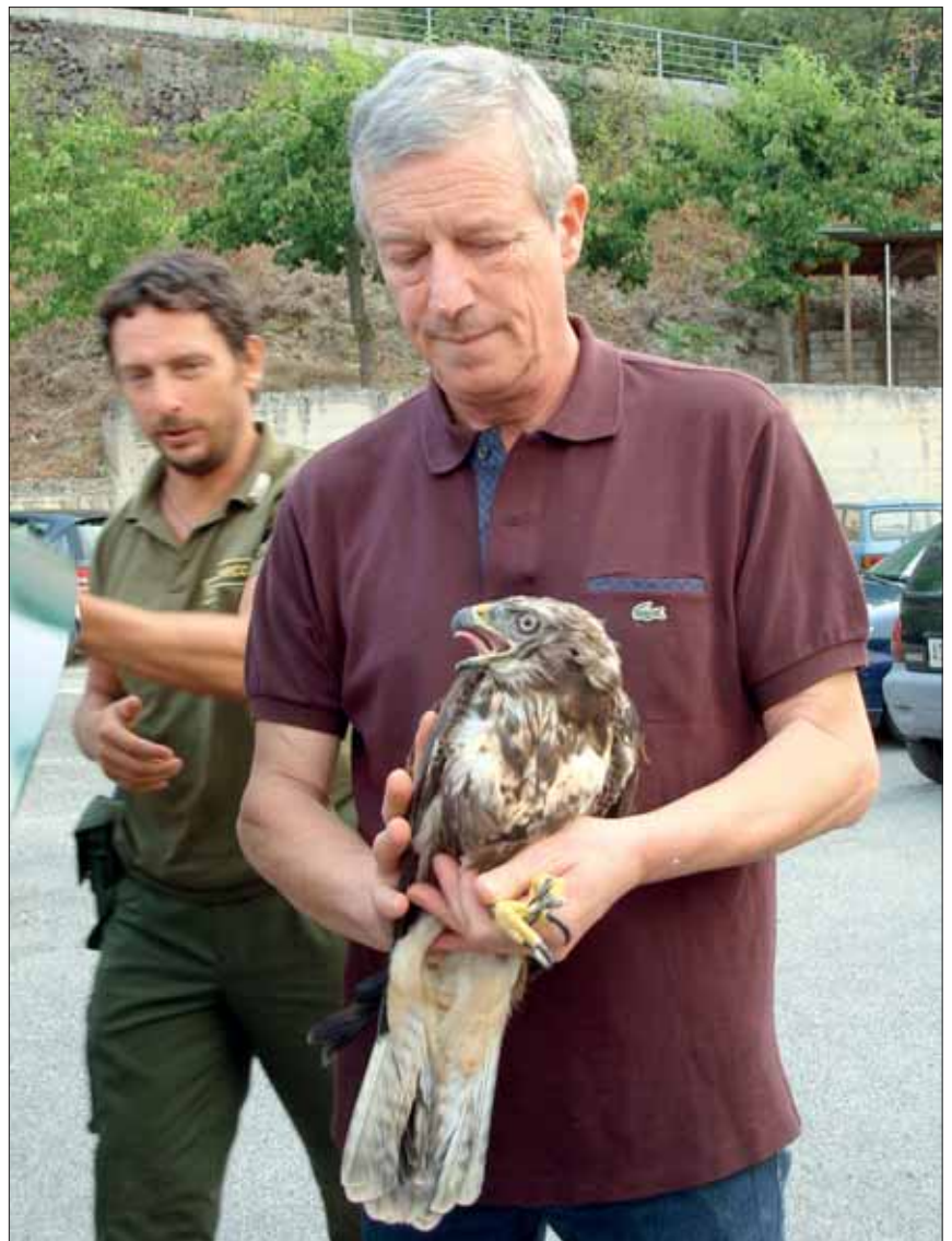
La femmina di poiana.

Chissà, magari l'anno prossimo ci sarà una nidata in più!