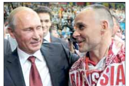
Putin con il DT della nazionale russa Ezio Gamba.