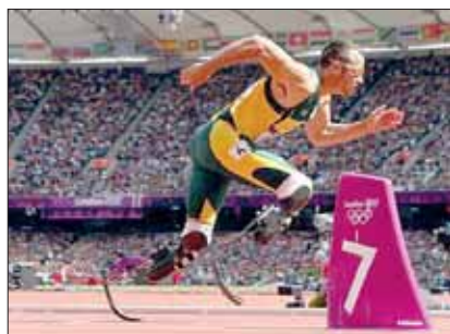
Oscar Pistorius in gara con i normodotati.