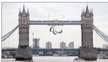
Il Tower Bridge con il logo delle Paralimpiadi.