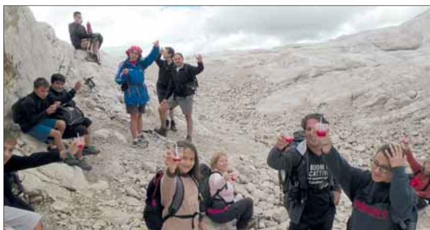
Granita sulla Marmolada.