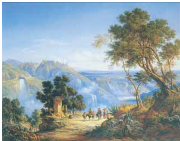
A.J. Strutt: La Valle dell'Aniene , olio (60 x 75), 1860.