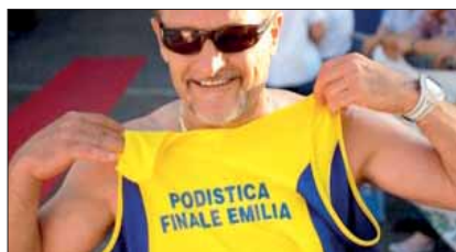
Omaggio alla Podistica Finale Emilia

In basso: Giro del Lago di Campotosto con gli amici di Finale Emilia