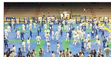
Il Palazzetto di Lignano durante gli allenamenti.