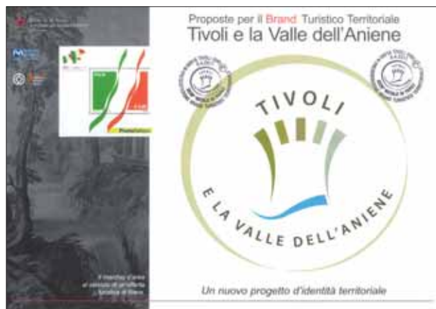
Catalogo delle “Proposte per il Brand Turistico Territoriale” con il Marchio adottato e l'annullo postale filatelico appositamente emesso da Poste Italiane in occasione del 3226° Natale di Tivoli.