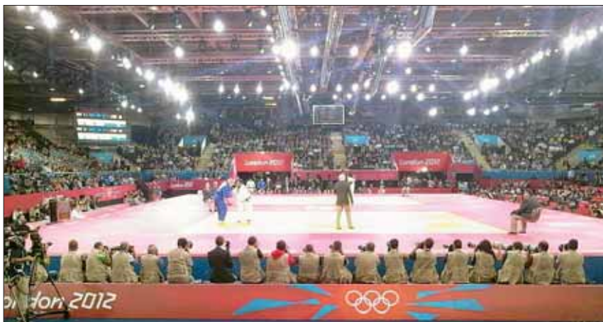
La struttura dello stadio ExCel dove si sono svolte le gare di Judo.