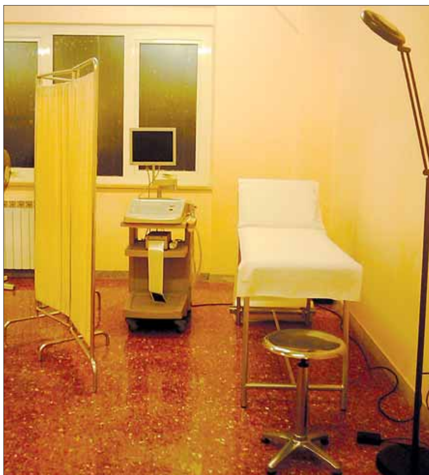
Studio ginecologico - ecografo.