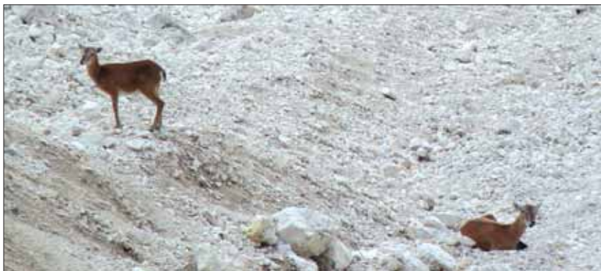
... altri incontri.

no Grande; il giorno seguente, per la via normale, arrivava sulla vetta del Corno Piccolo. Ci complimentiamo con i giovanissimi alpinisti e auguriamo loro un futuro pieno di soddisfazioni e grandi traguardi.