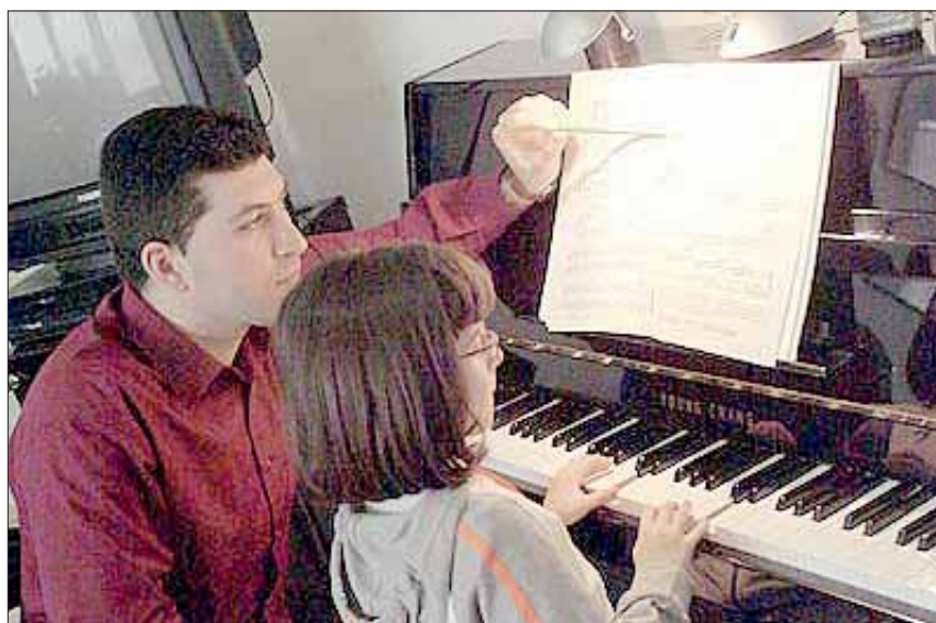
Il M° con un'allieva.

L'Associazione Culturale «Mondo Musica» ha riaperto i battenti dopo