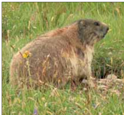
Incontri di montagna...