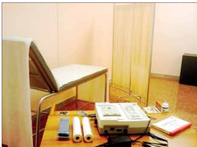
Studio ginecologico - macchina per monitoraggio.