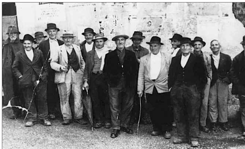
Gruppo di vecchi uomini sampolesi nel 1945: immagine di copertina di “Aùsula...”

Chi desiderasse avere una copia di “Aùsula...” potrà rivolgersi al Comune di San Polo dei Cavalieri, che provvederà a fornirla gratuitamente.