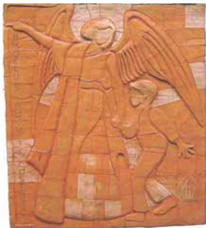
Scultura realizzata al Villaggio Don Bosco di Tivoli.

Opere nelle quali lo scultore, pur nel rispetto dei motivi imposti dalla sacralità degli argomenti rappresentati, ha voluto e saputo inserire te-