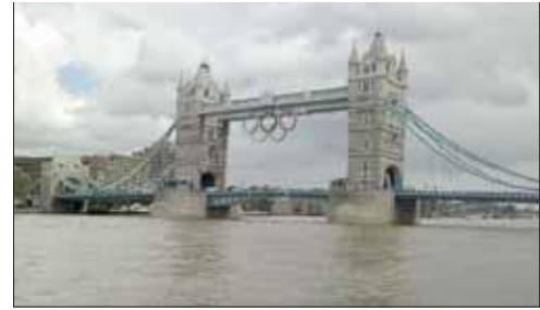
Il Tower Bridge di Londra con i cinque cerchi Olimpici.

Inoltre anche la notizia che una Judoka proveniente da un paese musulmano come l'Arabia Saudita ha partecipato per la prima volta a una manifestazione sportiva, ha fatto il giro del mondo. Durante i sette giorni di gara poi, come ho potuto constatare di persona, lo stadio ExCel di Londra è stato sempre gremito in ogni ordine di posto, con i biglietti esauriti già da molto tempo e i fan a sostegno dei loro atleti, come di consueto nel Judo, hanno dimostrato un grandissimo