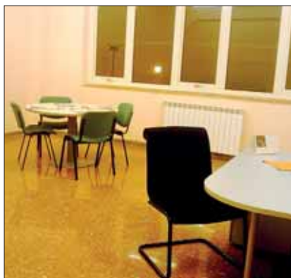
Studio consulenze e piccole riunioni.