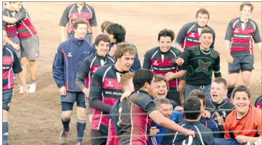
Tivoli Rugby Under 16.

Per info tel. 3356887168 - 3403704251 www.tivolirugby.it info@tivolirugby.it