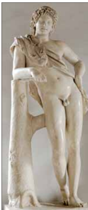
Leaning satyr - Musei Capitolini

Il satiro a riposo custodito ai Musei Capitolini è in marmo e misura cm 170,5. È una copia di età Adrianea del Satiro in riposo di Prassitele del IV secolo a.C., proveniente da Villa d'Este a Tivoli (dove era stata portata nella corte estense in seguito agli scavi effettuati nella Villa di Adriano) e donata da Benedetto XIV al Museo Capitolino nel 1753. Ceduta ai francesi in seguito al trattato di Tolentino, fu restituita alle collezioni capitoline nel 1815.