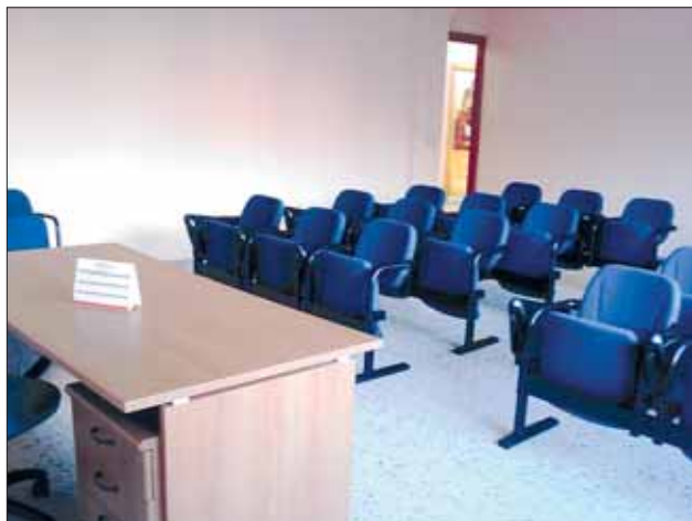
L'aula scuola consulenti familiari - sala convegni.