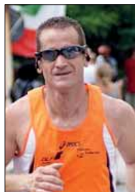
Giuseppe Tirelli Giro del Lago di Campotosto