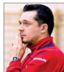
CM - Andrea Doria Tivoli-Guidonia USD Sales