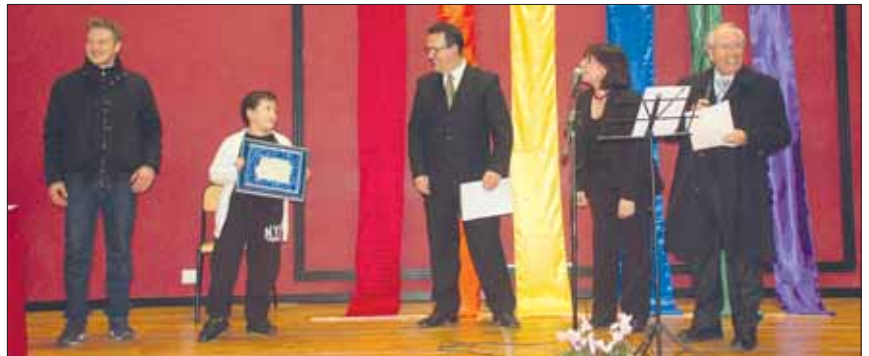
Primo classificato Sezione Alunni