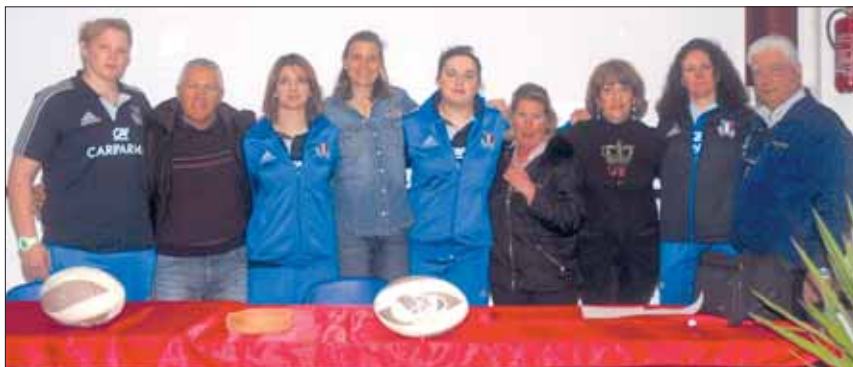
Nella scuola «A. Baccelli» di Tivoli

Il rugby - continua la manager azzurra - nelle scuole è un'esperienza fantastica, è un gioco per tutti, dunque per tutta la classe, senza distinzione di genere. La grande risposta avuta a Tivoli e Guidonia da parte delle alunne ne è la riprova; ora queste ragazze parteciperanno ai Campionati delle Scuole e ai Giochi Sportivi Studenteschi con le proprie scuole, e a breve esordiranno con l'Amatori Tivoli Rugby nelle attività Federali. Un ringraziamento va anche alla società tiburtina, che ha coadiuvato in modo impeccabile gli incontri».