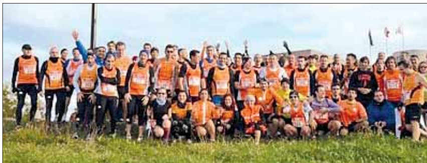
Orange alla Aspettando La Mezza

La corsa fa bene alla salute, ma in questo periodo possiamo senz'altro affermare che anche la corsa è uno sport in piena salute. Nonostante il momento di "depressione" generale che grava su questo paese, il running si conferma una disciplina in piena espansione. Il calendario si arricchisce in continuazione di nuove gare, anche di un certo spessore, e le gare che già da tempo fanno parte della tradizione podistica vedono lievitare il numero degli iscritti. Non ha fatto eccezione la Corriamo al Collatino , che quest'anno ha appunto superato la simbolica quota di 1.000 atleti giunti al traguardo di questa 10 km, giunta alla 7ª edizione; esattamente 1.056 atleti, 254 in più della scorsa edizione. L'assenza del Presidente Pino Coccia "si sente", ma la Task Force si dimostra pienamente autonoma anche in gare molto partecipate come questa e tutto proce-