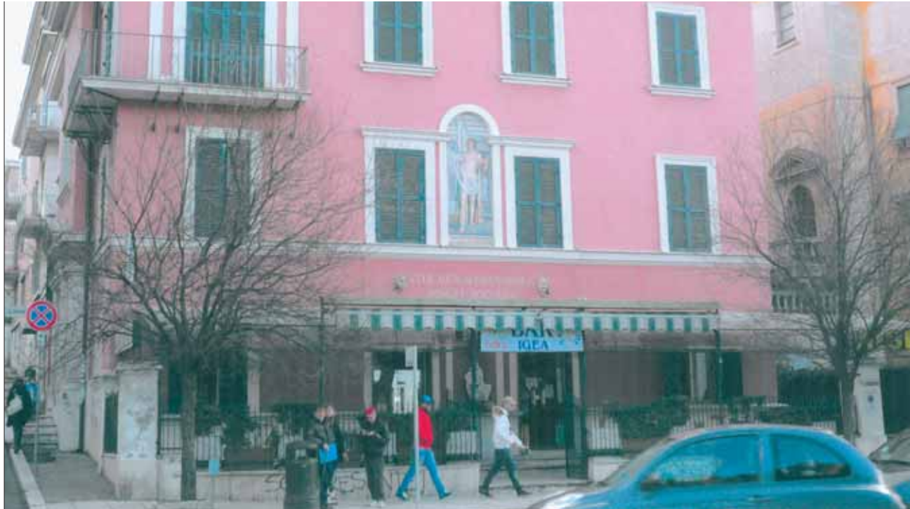
Il Bar Igea oggi

minilità, rappresentavano un invito all'avventura, a una delle poche avventure possibili nella nostra città dove un'uggia soporifera s'accompagnava, a volte, a un'inspiegabile alacrità. Di qui la nostra irrequieta ammirazione, le instancabili peregrinazioni e le continue attese nei dintorni delle ville.