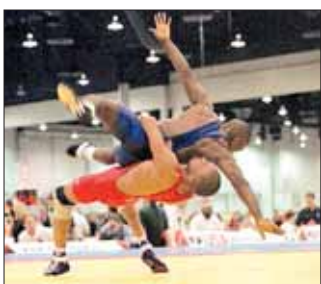
Una splendida azione di lotta

Io spero vivamente che il CIO torni su questa decisione perché uno sport bellissimo, di sostanza e quindi non virtuale, che ha una grande tradizione come la Lotta , non può essere tolto dalle Olimpiadi a favore di altre discipline alcune delle quali di valore spesso insignificante.