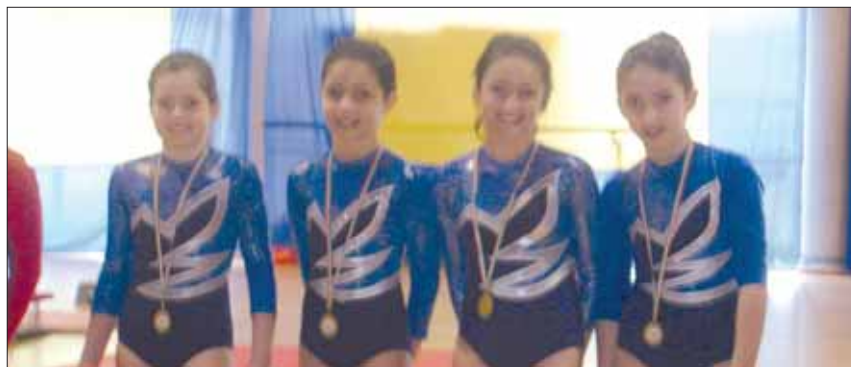
Le piccole atlete del gruppo "Allieve" dopo la premiazione

Si è svolto a Parigi, nello splendido e superaffollato Palazzo "Omnisport" di Paris-Bercy, il tradizionale e importantissimo torneo, terzo per importanza solo alle Olimpiadi e ai Campionati del Mondo, che ogni anno annovera tra i suoi partecipanti i migliori atleti del mondo. Quest'anno poi il torneo è stato caratterizzato dalle nuove regole arbitrali sperimentali che non consentono più prese di ogni tipo al di sotto della cintura e hanno cambiato radicalmente i punteggi attribuiti per sanzioni. A mio giudizio alcune delle nuove regole non sono giuste, mi riferisco soprattutto a quelle che vietano del tutto le prese alle gambe, mentre altre sono giuste e finalizzate a un Judo meno tattico e con più attacchi. Io credo però che andrebbe presa una decisione ancora più importante, va-