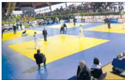
Adriana sul tatami a inizio incontro