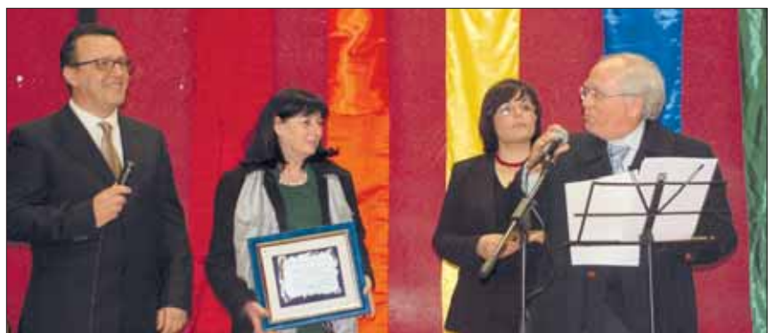
Primo classificato Sezione Nazionale