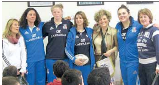
Nella scuola «Giovanni XXIII» di Villanova di Guidonia

Il 7 marzo nelle scuole medie e inferiori «Giovanni XXIII» di Villanova di Guidonia e «A. Baccelli» di Tivoli si sono svolti gli incontri con le ragazze della Nazionale Femminile di rugby, impegnate nel Sei Nazioni .