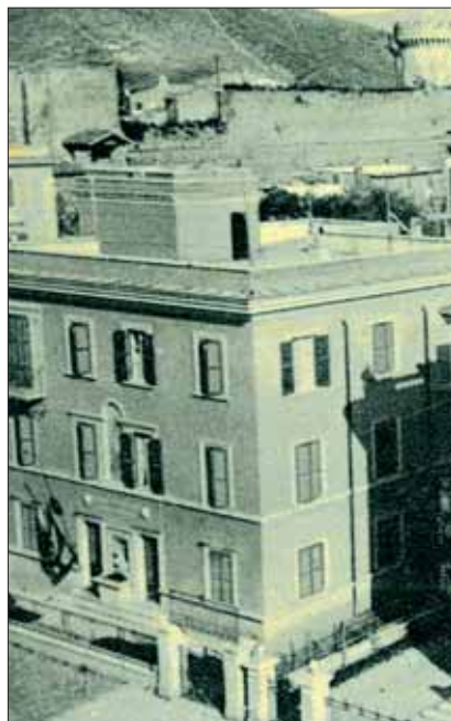
Il Bar Igea come appariva una volta

Non risulta agevole comprendere la funzione del bar: non era un club, non una associazione con le sue regole, non un dopolavoro e nemmeno un circolo; era arrivato ai suoi anni traendo semplicemente radici dalla nostra continua presenza. Da dietro la cassa dirigevano le attività del bar