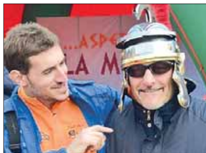
Le Premiazioni di Aspettando la Mezza