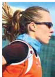
Aspettando la Mezza Lisa Magnago