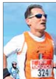
Aspettando la Mezza Marziale Feudale