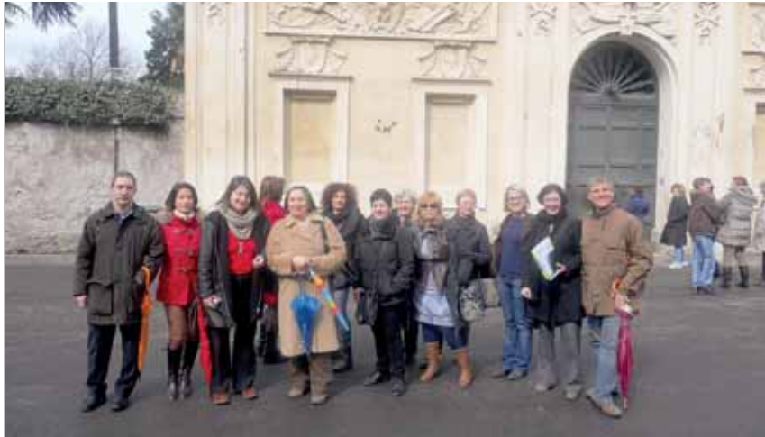
Il gruppo sull'Aventino

La serratura più celebre di Roma, dove romani e turisti di ogni parte del mondo hanno curiosato per scorgere la cupola di San Pietro oltre il bellissimo giardino, si