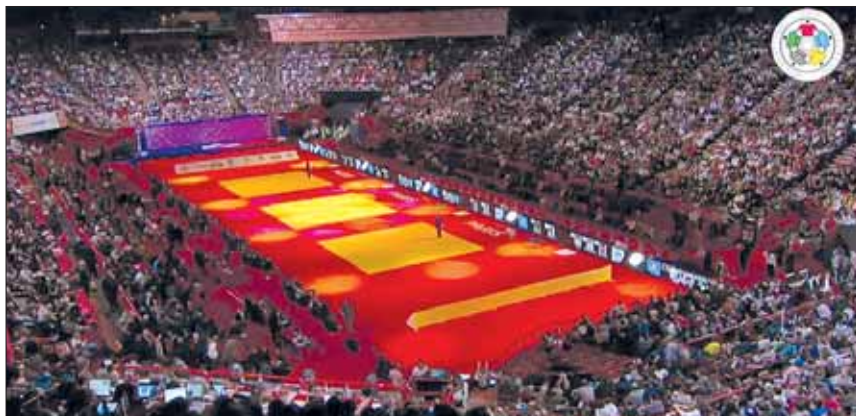
Il Palazzo di Paris-Bercy superaffollato durante il Torneo di Judo