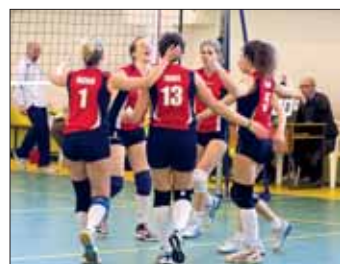
DF - Andrea Doria Tivoli-Guidonia ASD Pallavolo Poggio Mirteto

Nell'altra gara in programma, invece, i ragazzi guidati da mister Moschetti scivolano contro il Sales in un match che mostrato poca concretezza in attacco e tanti errori. Anche se 10 punti di vantaggio dalla terzultima lasciano