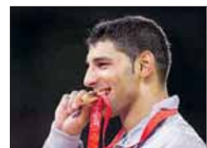
Andrea Minguzzi splendida medaglia d'oro nella Lotta a Pechino 2008