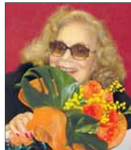
Il Presidente di Giuria