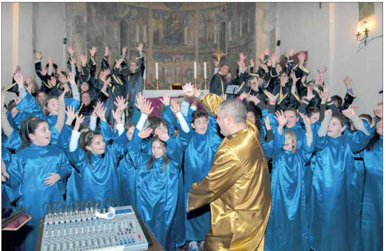
Il concerto Gospel

A lui va inoltre il merito della realizzazione del presepio dell'Associazione all'interno della “casa Gotica”.