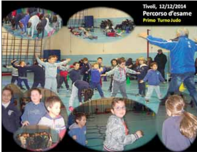
Alcuni bambini del corso di Judo in azione sul percorso