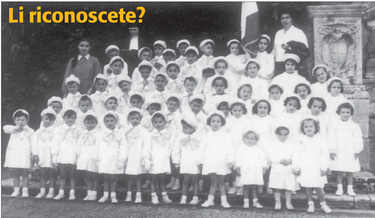
Asilo "Suore del Calvario" - Rione San Paolo (1953-1954?)

• ALFA – Associazione Love For Animals •