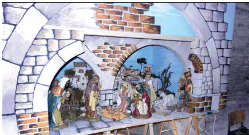
Un Presepe in allestimento

La bella giornata d'amicizia si è conclusa con l'acquisto di prodotti alimentari che sono stati consegnati ad una famiglia bisognosa e con lo scambio degli auguri di BUONE FESTE.