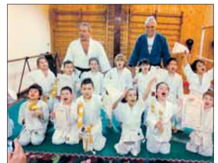
I bambini del primo corso ricevono la nuova cintura e il diploma