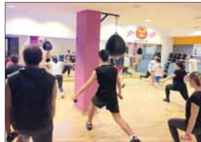
La classe durante una fase di allenamento del Fitness Funzionale

Proprio per questo è un'ottima proposta per recuperare velocemente la forma fisica ottimale, pur rimanendo all'interno di un contesto fitness quindi piacevole e coinvolgente, i moduli di allenamento sono diversi tra loro e ognuno mira al reclutamento particolare di alcuni gruppi muscolari con il sussidio di bende elastiche, manubri, dischi, bilancieri, esercizi a corpo libero o con step affinché gli stimoli siano sempre diversi tra loro e non monotono l'allenamento, a volte invece si lavora attraverso circuiti specifici che prevedono diverse stazioni e postazioni di allenamento che si ripetono in sequenze differenti e alternate, tipo di lavoro idoneo per il miglioramento della forza resistente e prestazioni di endurance ad alto dispendio calorico.