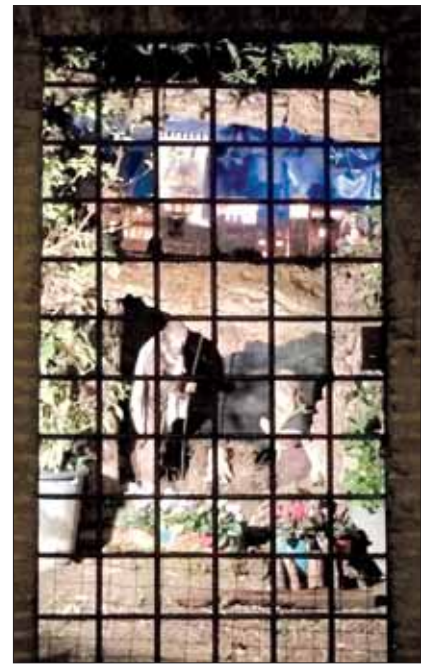
Il Presepe del Colle

Augurandoci che la bella iniziativa si ripeta negli anni a venire con sempre maggior successo, il nostro grazie