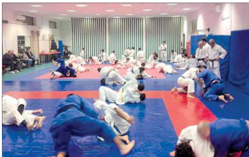
Gli atleti durante l'allenamento di lotta a terra