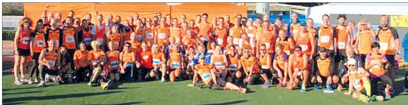
Gli Orange alla Best Women di Fiumicino