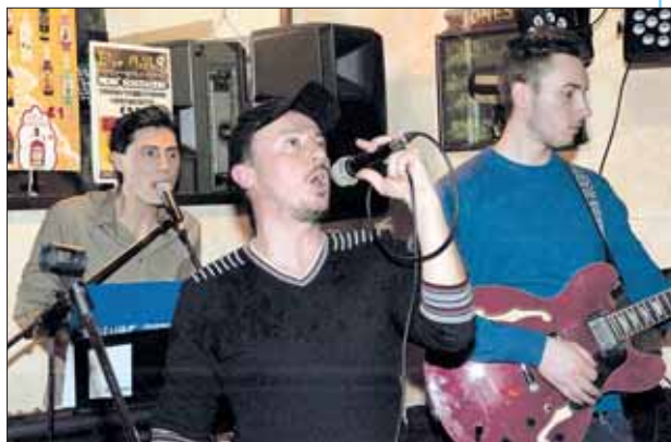
NordSudOvestEst, TributeBand Max Pezzali (883)