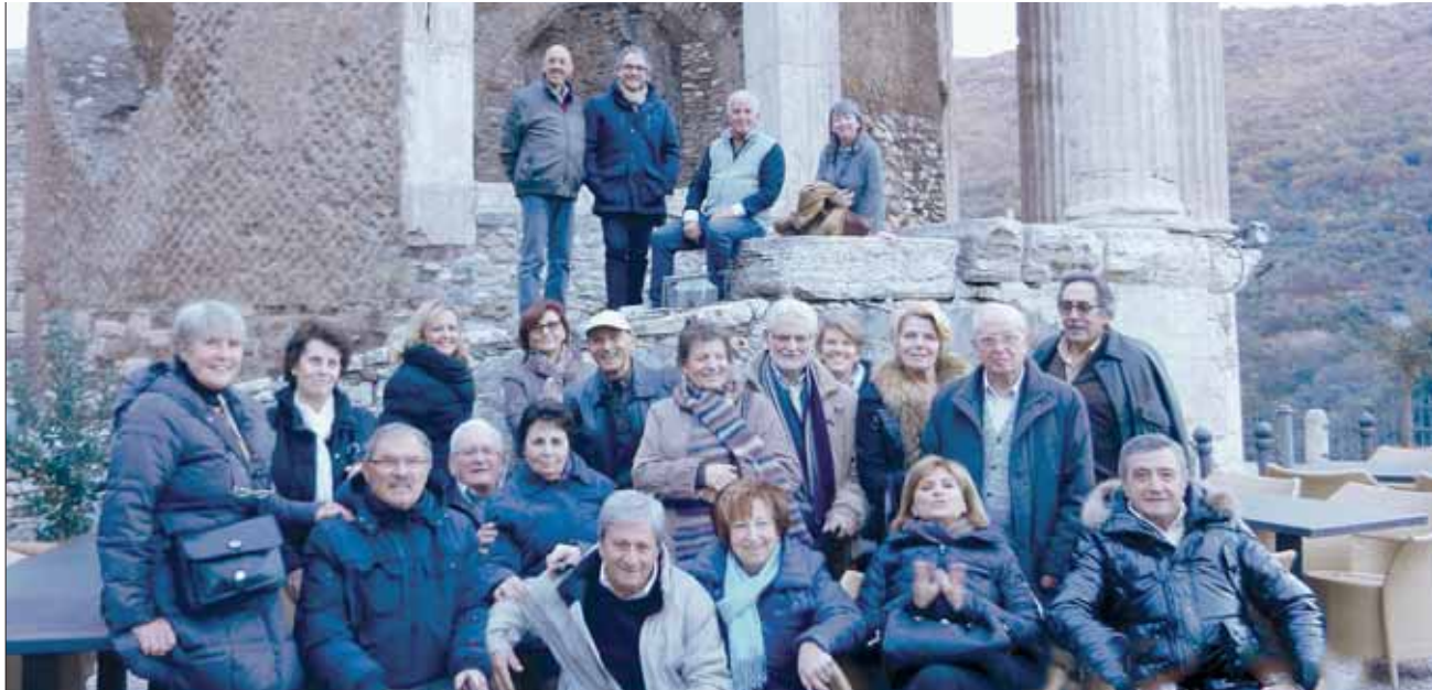
Arrivo al Ristorante "La Sibilla"

• Pensionati della «Banca Popolare di Ancona» •