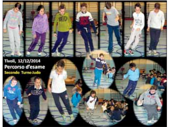
Alcuni ragazzi del corso di Judo in azione sul percorso