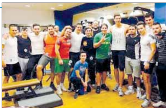
La gara di Bench Press