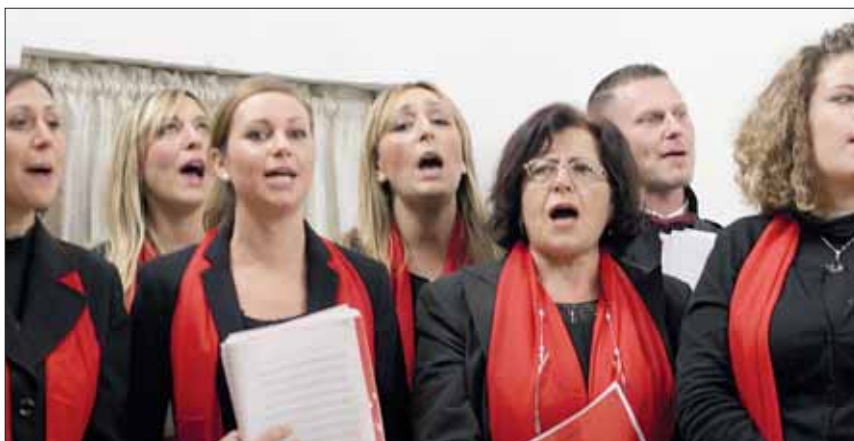
Le cantanti soliste