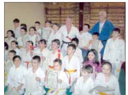
I ragazzi del secondo corso ricevono la nuova cintura e il diploma