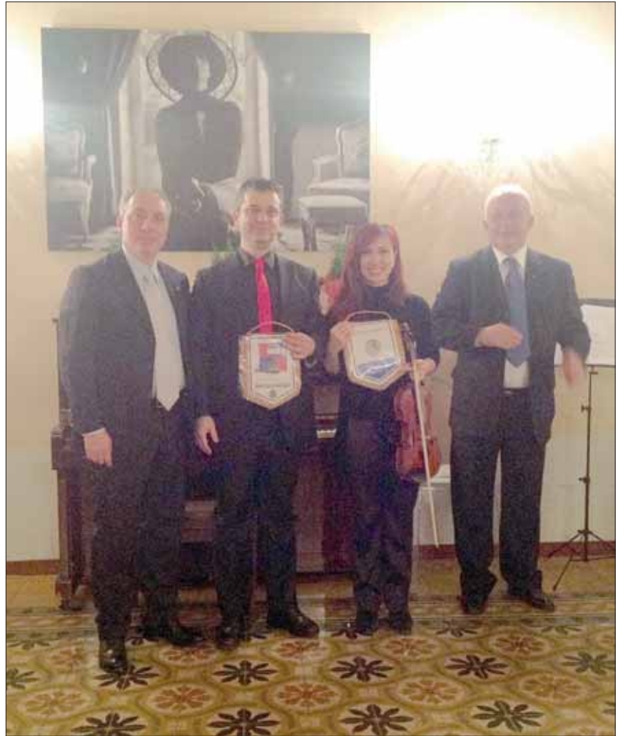
Il Presidente Strafonda in un momento della festa

Nel mese di gennaio sarà definita la composizione del Comitato che si occuperà della strutturazione concreta del Progetto Cittadinanza Attiva quindi, di concerto con l'Amministrazione Comunale, si stenderà un calendario di incontri per condividere iniziative e progetti sui quali il Club sta già lavorando.