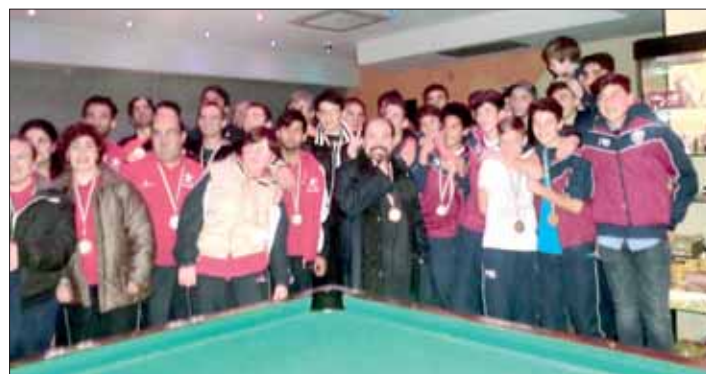
Al termine delle gare

IL CAMBIAMENTO NON AVVIENE DA BORDO CAMPO #PlayUnified