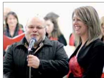
Don Paolo e la presentatrice