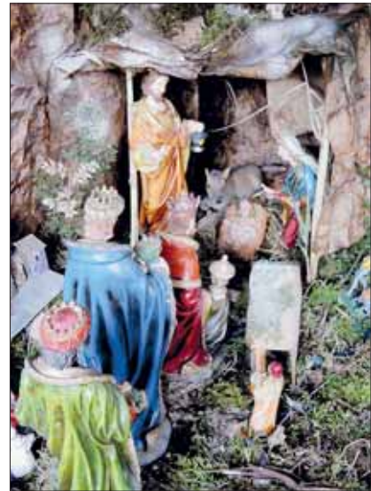
I Re Magi arrivati con i doni da offrire a Gesù Bambino