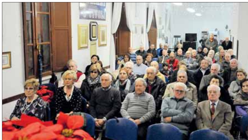
I soci in ascolto durante l'Omelia del Vescovo