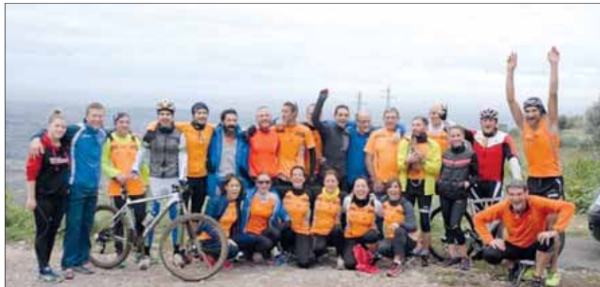
Gli Orange il giorno di Natale a Pomata

date domeniche e l'anno dei nostri Arancini . Un benvenuto al nuovo anno, l'anno del Vennennale, l'anno di un rinnovato impegno per fare sempre di più per aiutare chi dalla vita ha ricevuto poco o niente, l'anno del Cuore che Sorride. A voi tutti l'augurio per un nuovo anno ricco di salute, serenità e pace e di quanto ognuno di Voi desidera un nuovo anno dedicato a portare gioia e amore a chi non ne ha mai avuto.