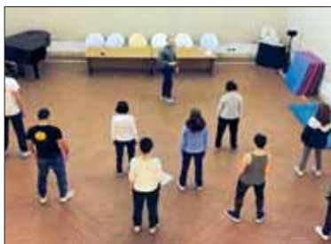
L'Open Day alle Scuderie Estensi