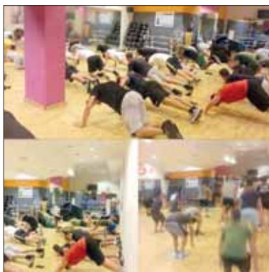
La classe di Boxe