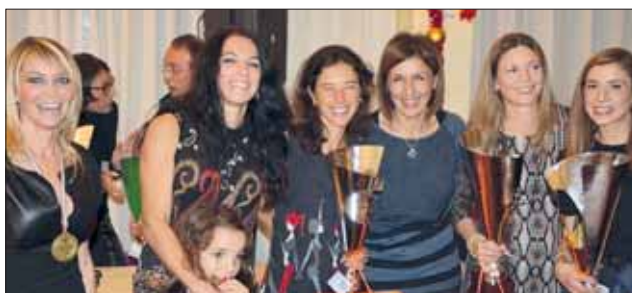
Cena Sociale - Le premiazioni Top Orange