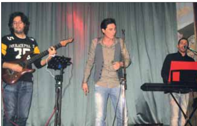
I Muro del Suono, tributo a Ligabue