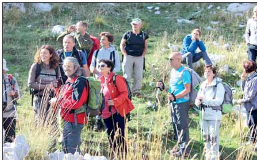
L'attesa viene poi premiata con l'avvistamento di un branco di cervi e, successivamente, di un camoscio.