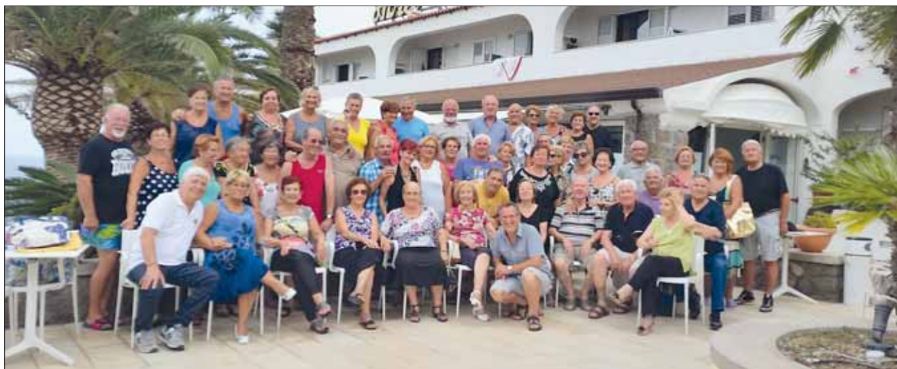
Foto di gruppo a Ischia