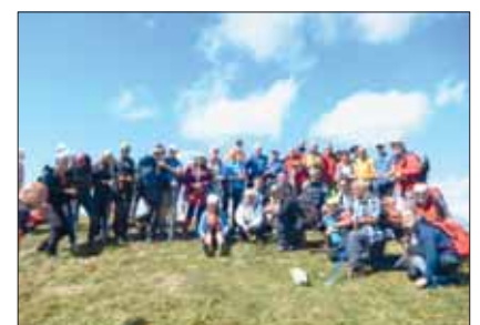
Sulla cima del Monte Gorzano