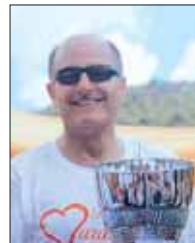
Il Presidente Maratonina del Cuore