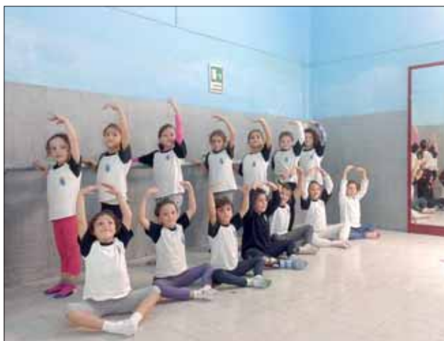
Le allieve della Scuola durante una lezione di danza