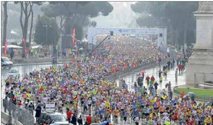
La Maratonia di Roma