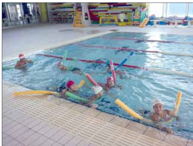
Gli allievi a lezione di nuoto