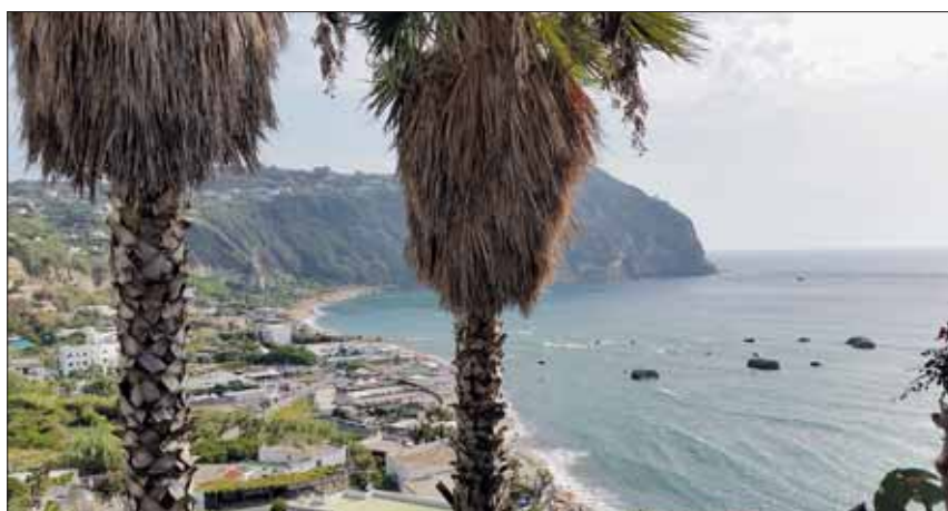
Vista dall'albergo sulla Baia di Citara

vette messe a disposizione dall'hotel. Il terrazzo dell'albergo ti offriva un panorama mozzafiato che da solo valeva le quattro stelle di categoria. Oltre al meraviglioso panorama che vedevamo dal terrazzo o dalle nostre camere, abbiamo anche apprezzato moltissimo le altre bellezze che ci ha offerto l'isola. Non possiamo non parlare del giardino botanico della Mortella con le sue stupende piante provenienti da tutto il mondo (Argentina, Africa, Nuova Zelanda, Australia e altro), delle terme di Poseidon con le sue piscine immerse nel verde dei suoi giardini (favolose), Ischia porto con il castello Aragonese e Sant'Angelo, uno dei posti più belli dell'Isola, e che dire della Chiesa del Soc-