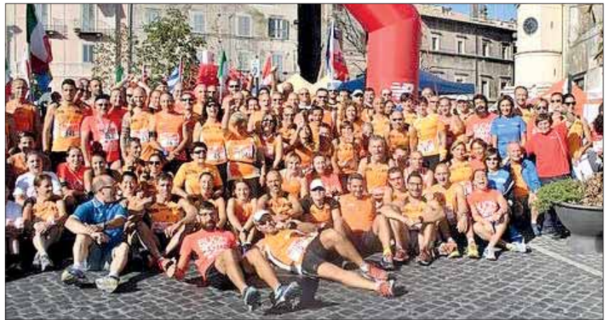
Il Presidente e gli Orange alla Maratonina del Cuore