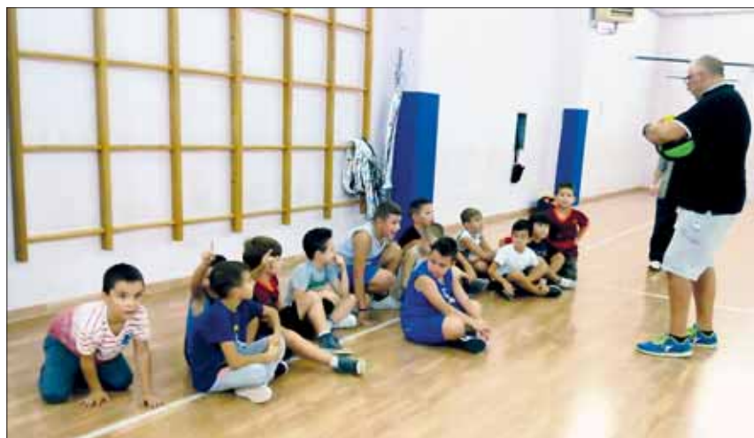
Corso di Minibasket