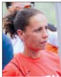
Carmen Lagamba Maratonina del Cuore