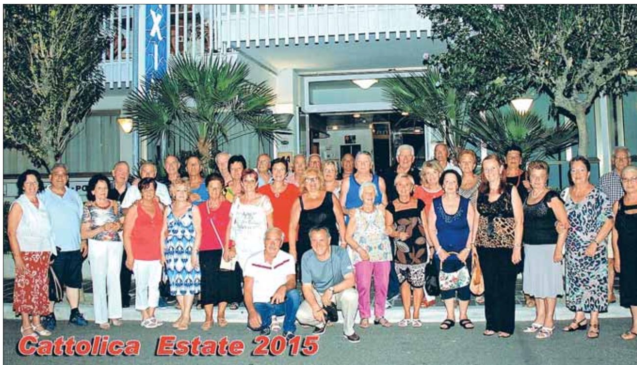
Il gruppo in vacanza a Cattolica

alloggiati presso l'Hotel Terme Royal Palm (ottimo albergo posizionato su di un promontorio che guarda la magnifica Baia di Citara) dove abbiamo trascorso un soggiorno meraviglioso, vuoi per la bellezza del posto, vuoi per l'ottimo trattamento che abbiamo ricevuto dal personale dell'albergo. La struttura, dotata di 4 piscine, due coperte e due all'aperto di cui una di acqua dolce, ci ha permesso di goderci le acque termali senza spostamenti. La spiaggia di Citara, rinomata e molto frequentata per la sua vicinanza alle Terme di Poseidon, distava una decina di minuti dall'albergo, quindi chi voleva andare al mare poteva usufruire delle na-