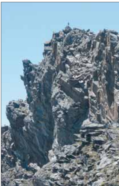
Sotto la vetta di Punta Percia mt. 3.227

Delle 113 vette ne ha scalate ben 32 in solitaria (4 quattromila e 28 tremila) tra cui Il Gran Paradiso mt. 4.061, la Zumstein mt. 4.563 (Monte Rosa), Cevedale-Zufal mt. 3.757 (Parco dello Stelvio) e il Similaun mt. 3.597 (Val Senales).