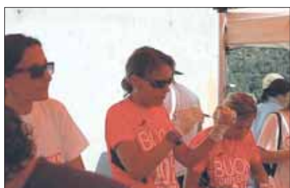
Il ristoro finale Maratonina del Cuore