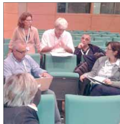
Il gruppo di lavoro delle Scienze della Terra

Il Dipartimento di Scienze del Liceo Spallanzani