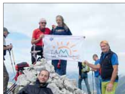
Cima del Monte Amaro di Opi