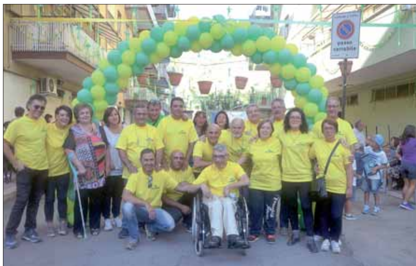
Il Comitato di Via Acquaregna