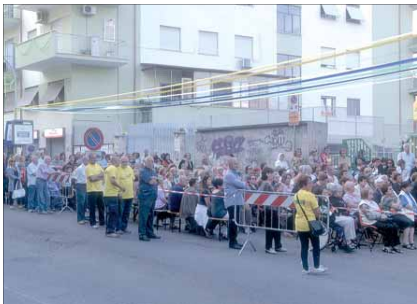
Un momento della S. Messa