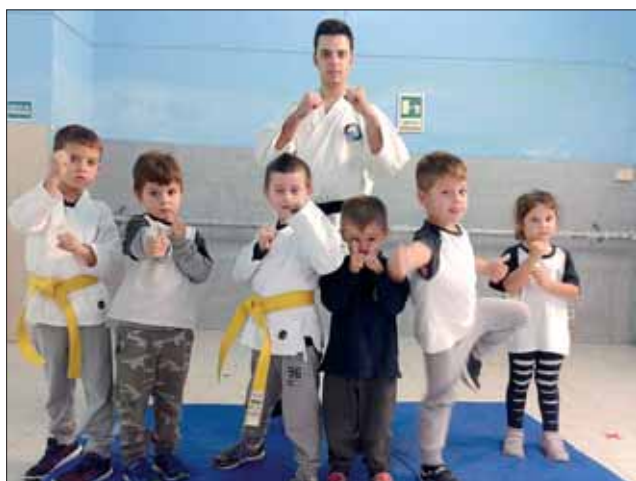
Gli allievi della Scuola durante una lezione di Karate