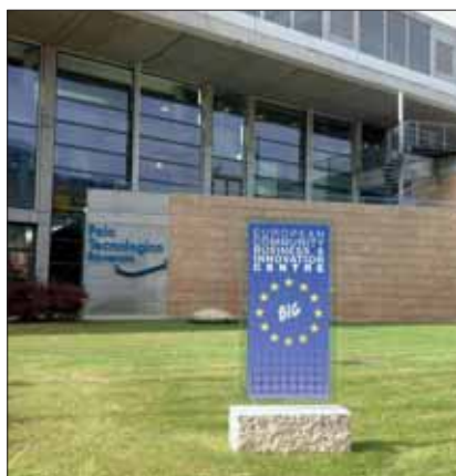
La sede di Trentino Sviluppo, in cui è stato ospitato il seminario scientifico del Miur.