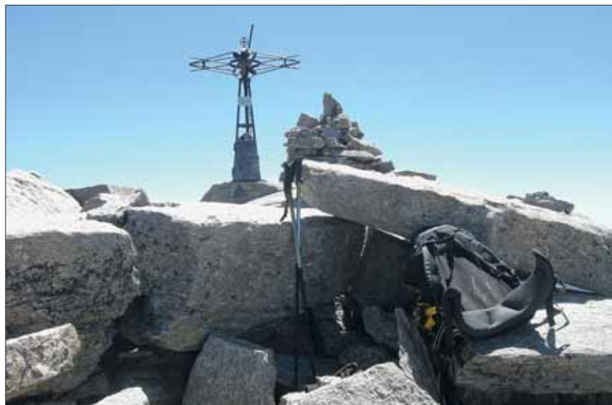
In solitudine sulla Vetta della Tresenta m. 3.609