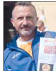
Massimo Gentile Maratonina del Cuore