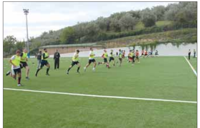
I test atletici