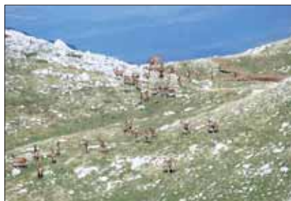
Un branco di cervi