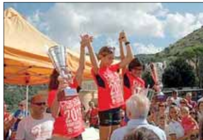
Il podio femminile Maratonina del Cuore