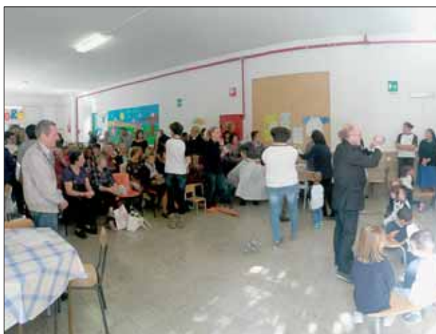
Un momento della Festa dei Nonni