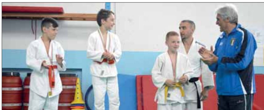
Judo – Alcuni bambini sul podio