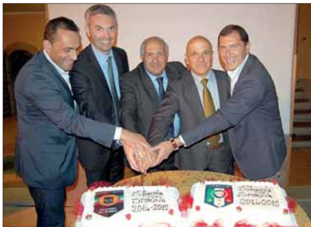
Il taglio della torta