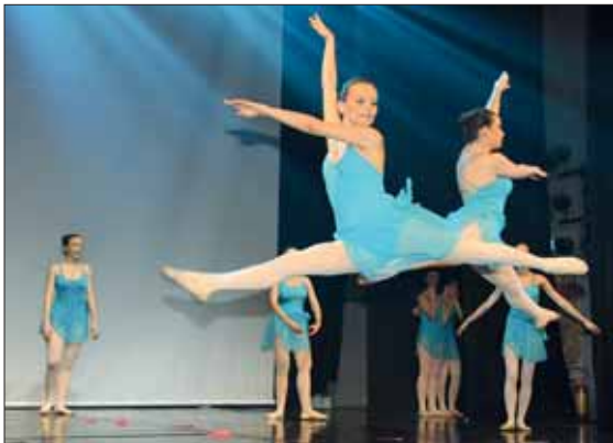
Danza Classica - Una splendida coreografia