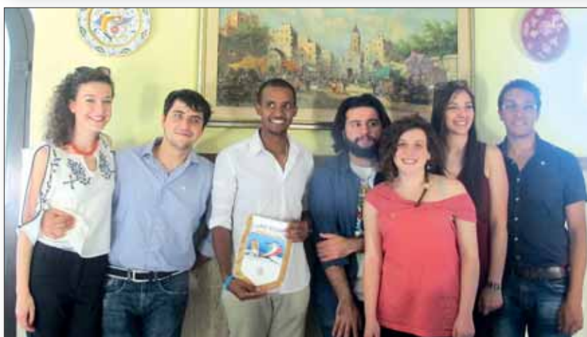
In queste due foto i ragazzi del Leo Club Guidonia Montecelio con i ragazzi di Don Benedetto