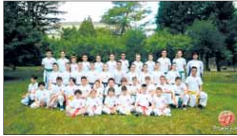
Stage 2015 bambini e ragazzi

Il nostro "lavoro" lo sappiamo fare bene e, come si dice, siamo una garanzia di qualità sia da un punto di vista marziale che, soprattutto per i più giovani, da un punto di vista educativo.