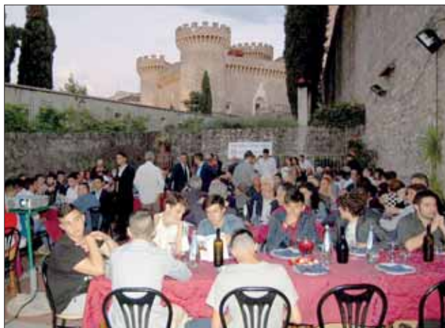
Alle pendici della Rocca Pia