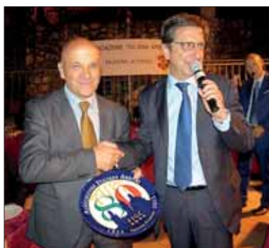
Nesi consegna un omaggio