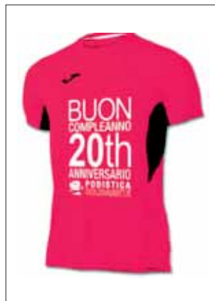
La maglia del Ventennale

Cari amici Orange , come ormai saprete quest'anno si festeggia il Ventennale della Podistica Solidarietà . Pertanto stiamo cercando in ogni modo di onorare al meglio questa ricorrenza importante tramite una serie di iniziative; tra queste in particolare la creazione di una maglietta tecnica ufficiale "Limited Edition", colore arancio flou con inserti neri, marca Joma, che potrete acquistare