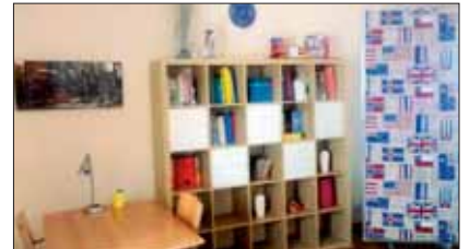
Una delle nostre aule