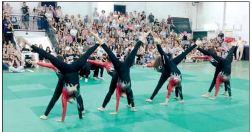
Artistica - Le ragazze della Dynamica in azione