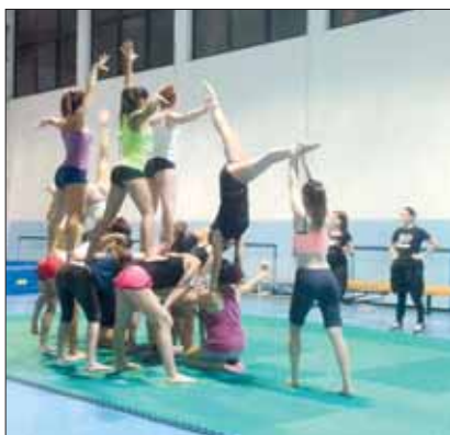
Artistica - Le ragazze preparano il saggio nella palestra del Liceo «I. d'Este»