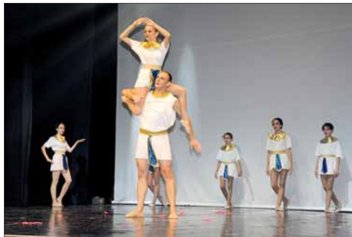
Danza Classica - Una bellissima coreografia