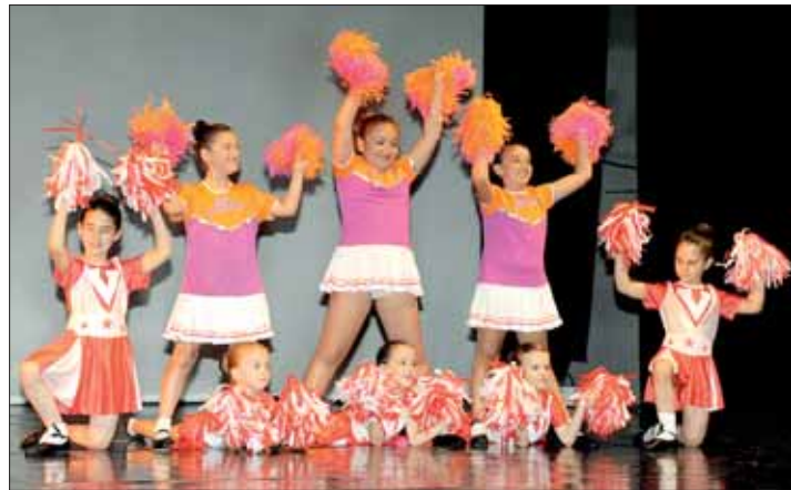
Danza Moderna - Le bambine in azione