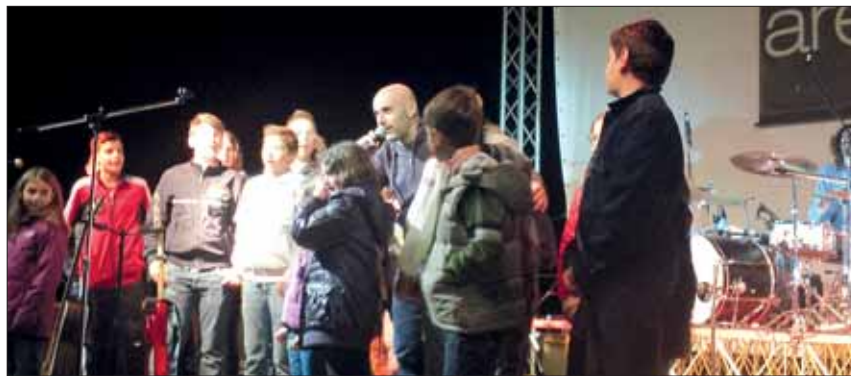
Con gli «Area 765»

Un esempio di come si possa lavorare tutti insieme intorno al senso di appartenenza a un territorio: LA SABINA.