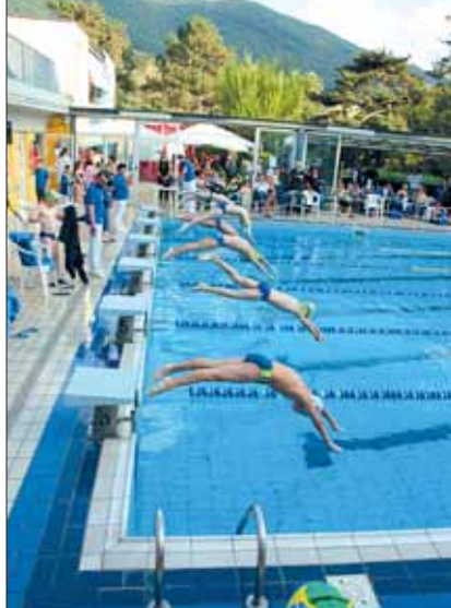
La partenza dei 50 rana