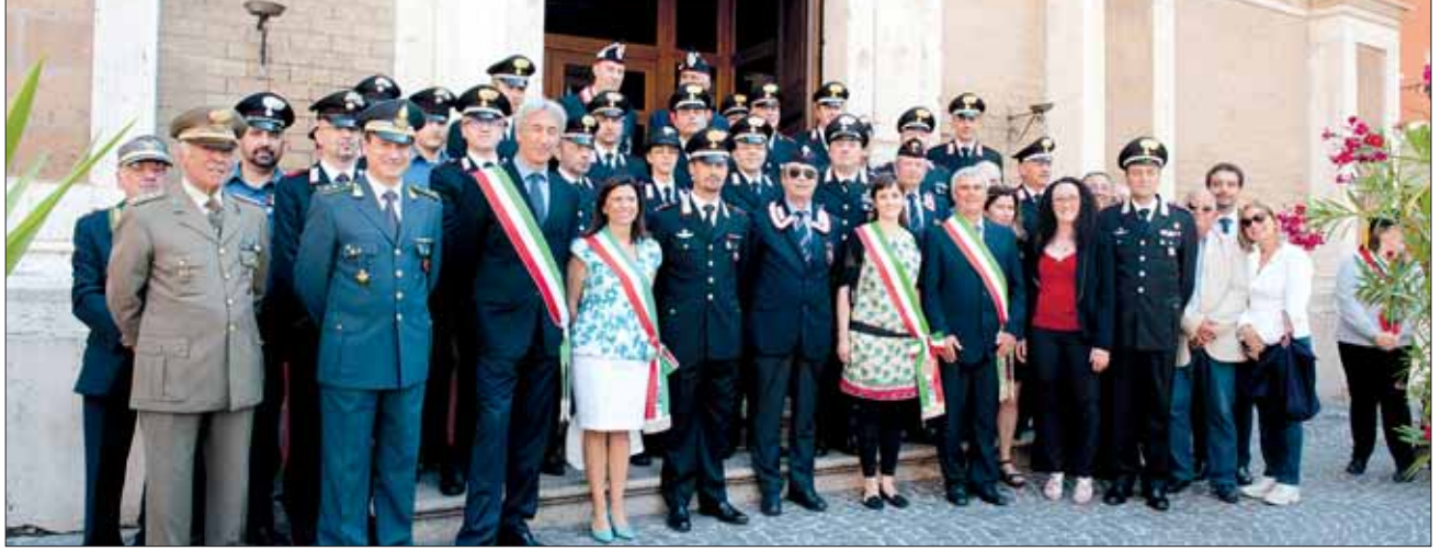
• Associazione Nazionale Carabinieri di Tivoli •