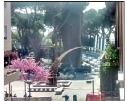
La vista dal nostro balcone