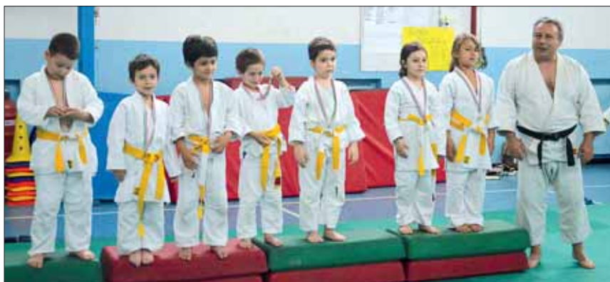
Judo – I piccolini sul podio dopo il percorso