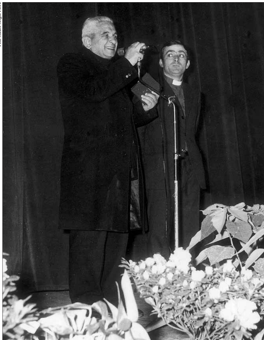
Don Nello e Don Benedetto: il fondatore e l'erede