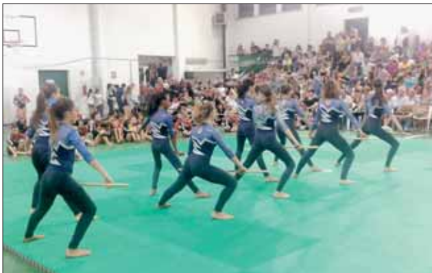
Artistica - Le ragazze del Club Sportivo Tivoli in azione