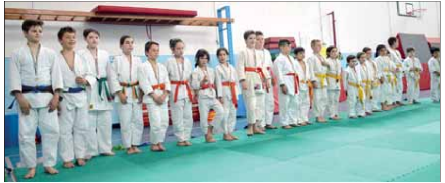
Judo - I piccoli dopo la gara con le medaglie