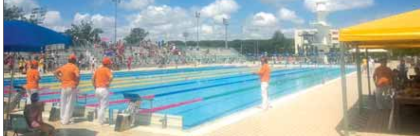
La piscina olimpionica di Riccione