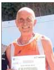
Giovanni Golvelli Ecotrail Run