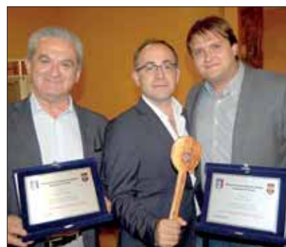
Alcuni dei premiati