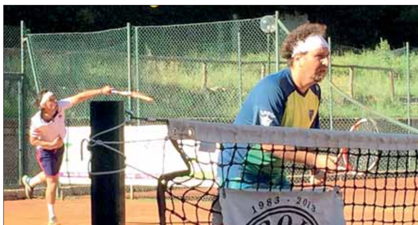
Un momento del doppio della serie d3 di tennis