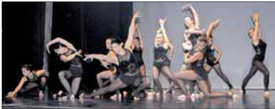
Danza Classica - Una splendida coreografia