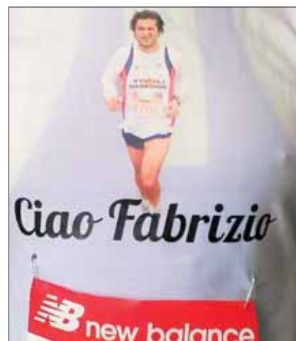
Memorial "Fabrizio Irilli"