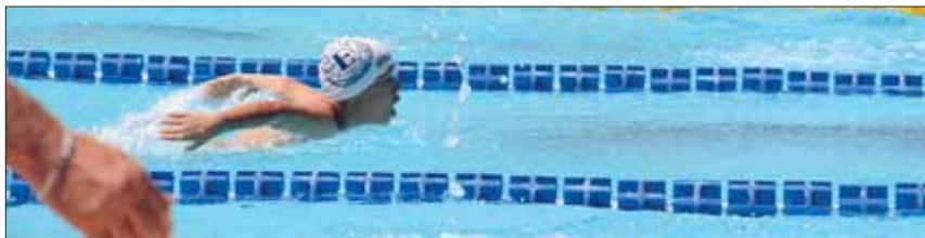
Durante i 50 farfalla a Riccione