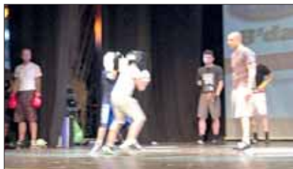
Parte del gruppo dei giovani