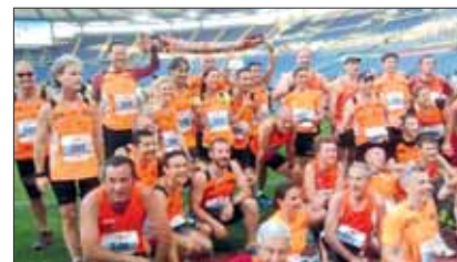
Gli Orange all'Alba Race