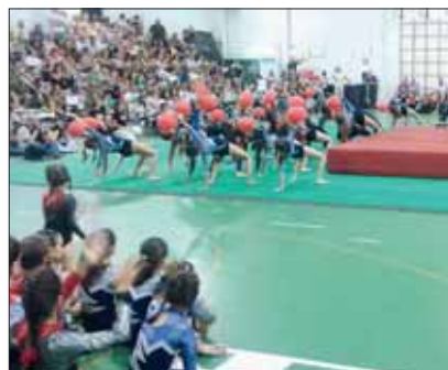
Artistica - Le bambine del Club Sportivo Tivoli in azione