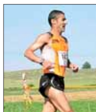
Francesco de Luca Corriamo al Cavaliere