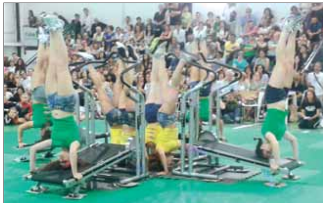
Artistica - Le ragazze della Dynamica ancora in azione