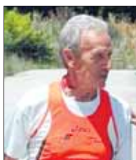
Elio Dominici Millenium Trail