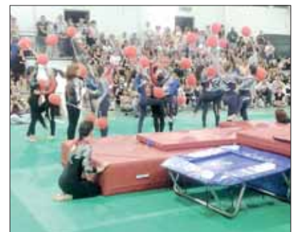
Artistica - Le ragazze del Club Sportivo Tivoli in azione