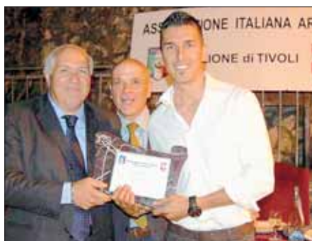
La consegna del Premio Nazionale "Lallo Mariotti"