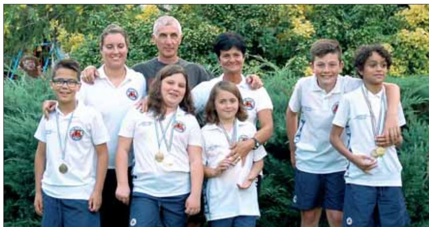
I partecipanti alle gare categoria "Giovani"

Info: EMPOLUM SPORTING CLUB Via Empolitana, km 6,800 tel. 0774.447363 - 0774.449229 www.empolum.it - info@empolum.it fb: empolum sporting club