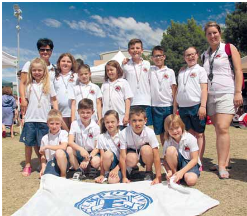
Foto di gruppo ai Campionati Italiani a Riccione