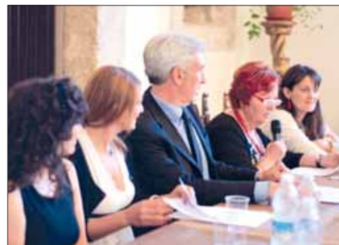
Due immagini del tavolo della Presidenza del Premio Donna Luisa Montanari 2015