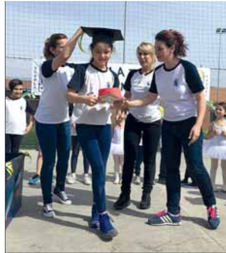
Cerimonia di consegna del tocco e diploma

È stata una giornata indimenticabile, piena di professionalità, divertimento, gioia e passione, tutte caratteristiche proprie della scuola "Taddei".