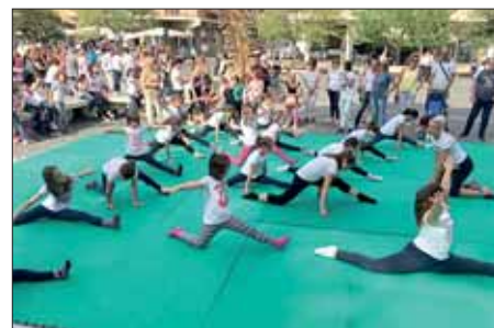
Le giovanissime del Convitto Nazionale durante la ginnastica