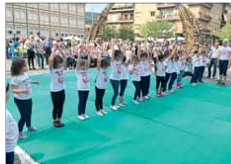
Le giovanissime allieve del Convitto Nazionale "Amedeo di Savoia Duca d'Aosta"