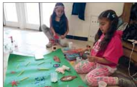
Al laboratorio teatrale junior si creano le scenografie