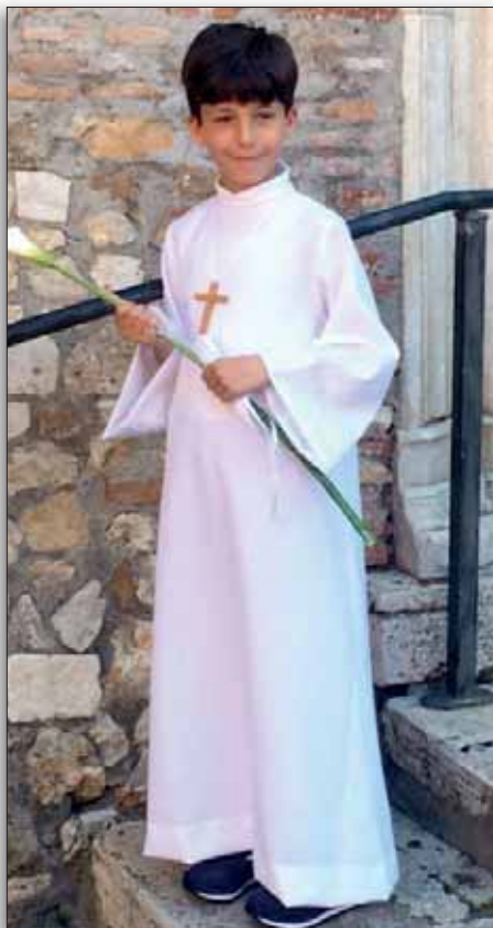
Tivoli, 3 giugno 2017

come quella del suo primo incontro con il Signore Gesù; i nonni, i genitori, gli zii, la sorella e tutti i cuginetti gli augurano con affetto di continuare sulla strada intrapresa, seguendo i passi che portano alla vera Felicità .