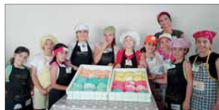
3° Corso Piccoli Chef - Maggio 2017

ASSOCIAZIONE POLISPORTIVA DIL. E CULTURALE Istituto Comprensivo Tommaso Neri - Tivoli Terme - Sede: Via Pio IX c/o Scuola dell'Infanzia - 00011 TIVOLI TERME - cell. 345.5910287 mail: ass-arcobaleno-tivoliterme@live.it sito web: www.assoarcobaleno.it