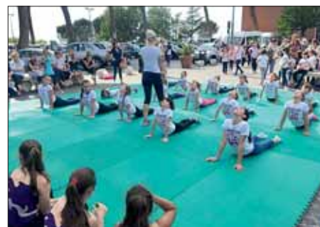
Le ginnaste durante la lezione dimostrativa