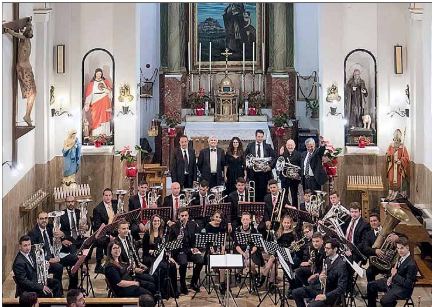
L'«ensemble» di tutti i corsisti.