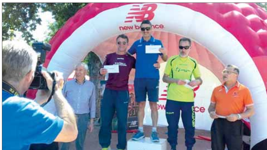
Premiazione della Tivoli Marathon seconda classificata alla Maratonina di Villa Adriana

Una bella giornata e una vittoria importante che ci carica per le prossime sfide, dove venderemo cara la pelle!