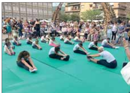
Ancora qualche momento dell'esibizione