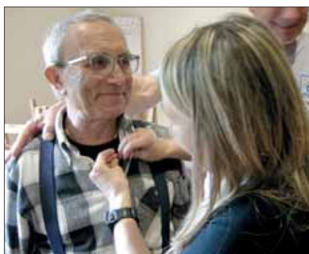
Alcune premiazioni per l'anzianità di iscrizione al C.A.I.