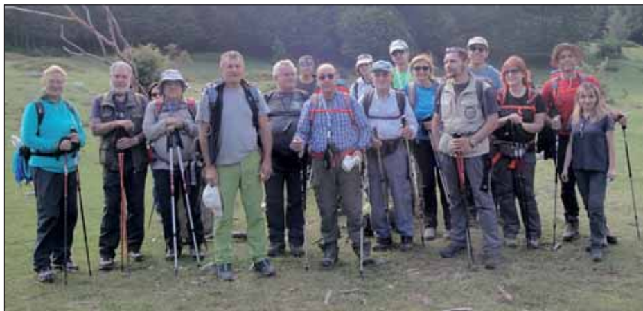
L'escursione sul Monte Pollino (2.248 m) è stata "condivisa" con la Sezione C.A.I. di Catanzaro, suggellata sulla via di ritorno da questa fotografia

«Cari Amici del C.A.I. di Tivoli, termina qui il mio impegno riguardante l'escursione in Lucania, al Parco del Pollino, conclusa ieri sera tardi con il faticoso e lento ritorno a casa... Mi preme però ringraziarvi tutti per avere accettato di trascorrere insieme 4 giorni tanto gradevoli e ricchi di condivisioni sportive, culturali, ambientali e caratteriali da lasciarmi a lungo un ricordo indelebile di questa speciale escursione. Dunque, alla prossima!».