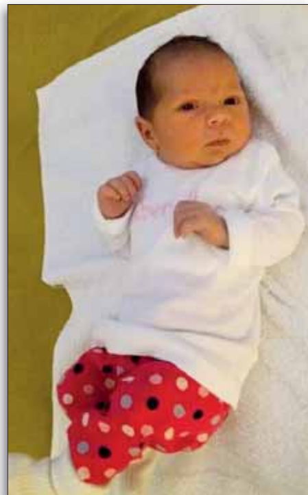
Il 30 maggio 2017 è nata a Tivoli