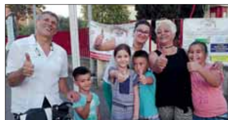
Piccoli partecipanti ai balli - 10 giugno 2017