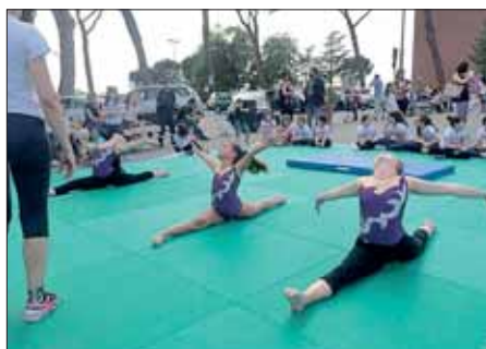
Qualche momento durante l'esibizione