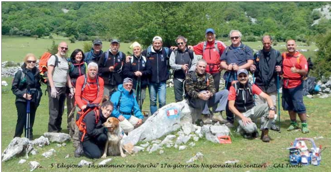
5ª Edizione "In cammino nei Parchi" 17ª giornata Nazionale dei Sentieri - CAI Tivoli