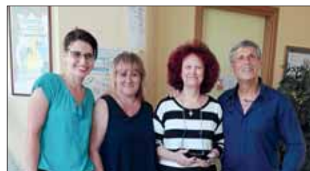
Chiusura dell'anno scolastico - I.C. Tivoli Bagni