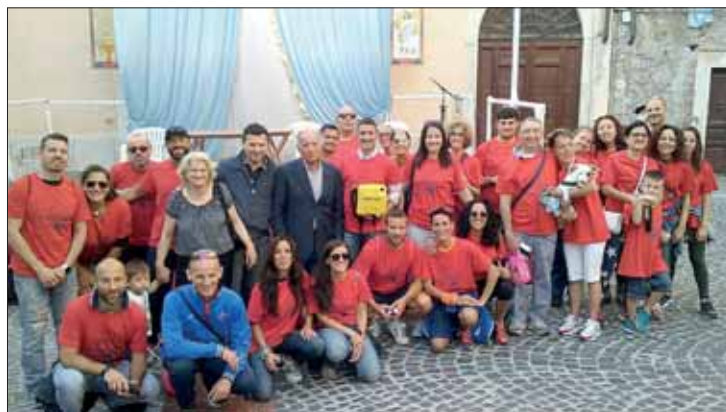
Il gruppo Orange con il defibrillatore donato al Villaggio Don Bosco