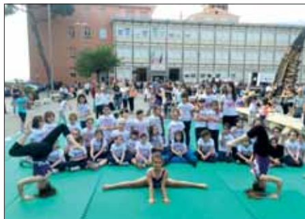
Una foto di gruppo con le nostre giovani allieve durante l'esibizione