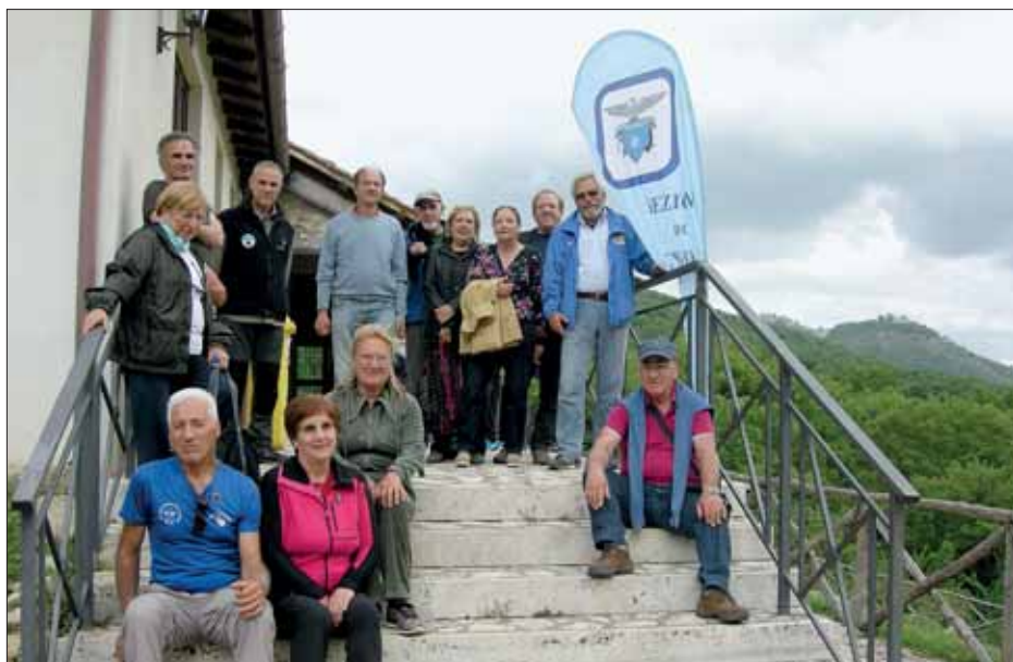
Foto di gruppo di alcuni Soci all'ingresso del Casone

Anche quest'anno, a primavera inoltrata, si è “celebrata” la Festa della Sezione C.A.I. di Tivoli , nel bosco della Selva, una porzione di circa 250-300 ettari di territorio demaniale (nel Comune di Castel Madama), gestito dall' Ente Università Agraria di Castel Madama . Si trova a Est dell'abitato di Castel Madama ai confini con i Comuni di Vicovaro, Sambuci e Ciciliano, raggiungibile con la S.P. Empolitana da Sud e con le strade rurali delle Fratte e delle Cese da Ovest e da Nord-Ovest. Il luogo si è conservato fino a noi quasi integro, subendo soltanto alcuni parziali cambiamenti culturali nella prima metà del '900 che il tempo lentamente sta riassorbendo. Gli elementi antropici sono limitati ai resti di cisterne, di edifici e di un sepolcro di età romana; ai fontanili e al Casone, un casale di campagna della seconda metà del Settecento, posto in mezzo al bosco.