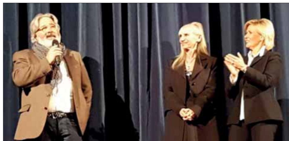
Sul palco del Teatro Giuseppe