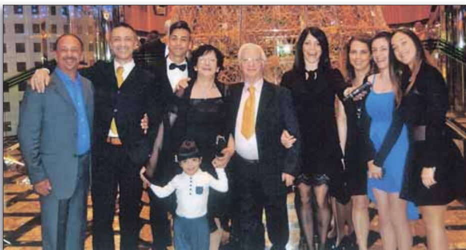
Il 30 aprile 2017