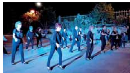
Festa patronale - Villalba