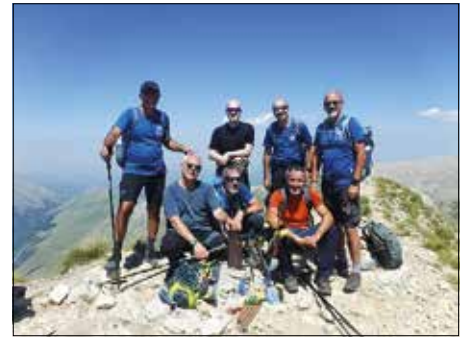
Cima del Redentore - escursione ad anello del 31 Luglio

Infine, come di consueto si riporta, di seguito, il programma escursionisti-