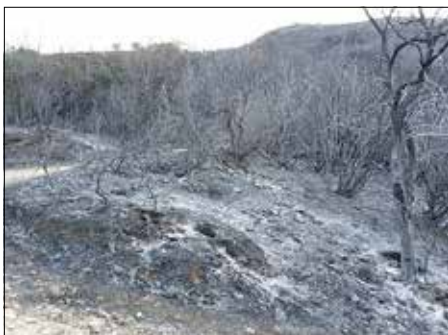
Devastazione nella riserva naturale di monte Catillo

Da qui ci siamo immessi sul sentiero di mezza costa, parallelo al fondo valle, che ci ha condotto fino allo Stazzo di Solagne (1700 mt.), rifugio a uso dei pastori. Abbiamo poi proseguito sul vero e proprio sentiero che risale uno stretto vallone. Proseguendo nella ripida ascesa e voltandoci periodicamente indietro per ammirare in lontananza il ben definito e suggestivo Lago di Campotosto, siamo giunti a una sorgente che per solo per pochi metri lascia scorrere l'acqua in