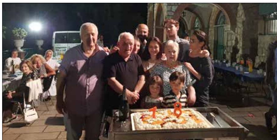
Con i familiari