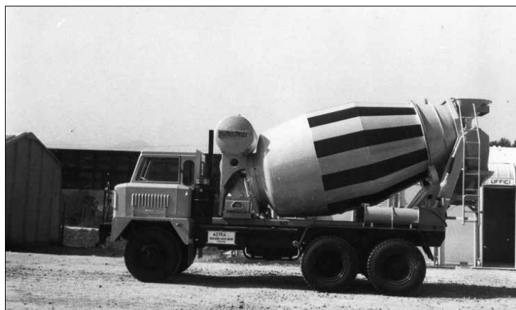
La prima autobetoniera