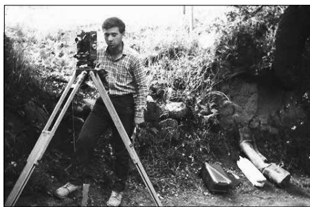
Un rilievo in zona Fontanilaccio (Settembre 1966)