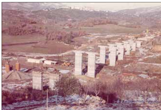
Il Viadotto Cadore in costruzione

Nella vita di cantiere conta la squadra e chi occupa una posizione di coordinamento deve farsi rispettare. Era ed è un po' come l'ambiente militare, miti-