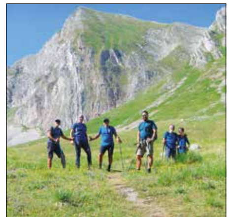
Foto di gruppo - escursione a cima Venacquaro e cima Falasca del 3 Luglio