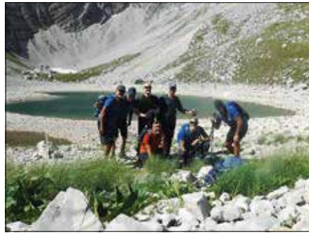
Laghi di Pilato - escursione del Redentore del 31 Luglio

due coppie di alpinisti impegnati nella risalita delle pareti strapiombanti dove la roccia è buona per l'arrampicata. Faticosamente raggiungiamo Forca Viola, una sosta per ricaricare le energie e puntiamo verso Cima del Redentore 2.448 m, seconda vetta del gruppo, a ridosso della cima, su crinale erboso, spuntano numerose stelle alpine appenniniche, è fatta, la piccola croce di vetta è raggiunta. Camminando su esile cresta ci spostiamo sopra pizzo del Diavolo dal quale il panorama a 360° è mozzafiato, comincia ora la lunga discesa verso Forca di Presta ma la giornata ci regala ancora emozioni..... il volo planato di un'aquila Reale e l'incontro con una delle sue prede preferite la lepre...».