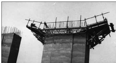
Un pulvino in costruzione

gato però dalla comprensione, ma c'è sempre da imparare.