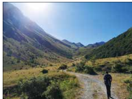
Escursione a cima Venacquaro e cima Falasca del 3 Luglio