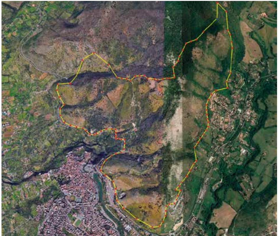
Riserva Monte Catillo - il perimetro dell'incendio