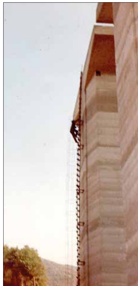
Chi sta salendo sono io