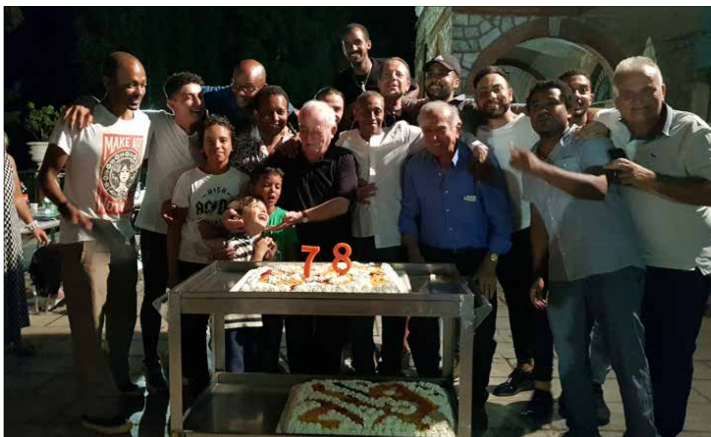
Con i Ragazzi e il Presidente