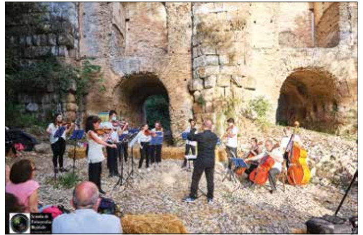
Orchestra Gli Archi del CDM