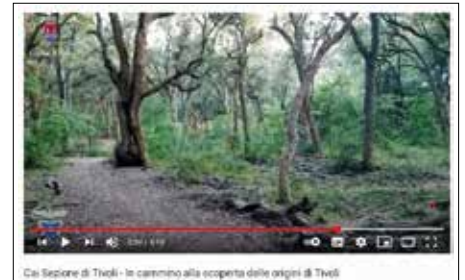
Frame del video CAI su monte Catillo