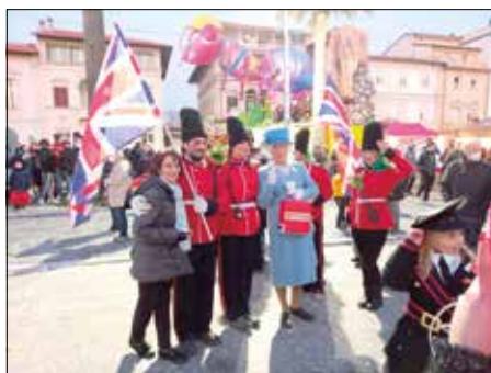
Gita a Viareggio

Un caro saluto dal Presidente e da tutto il Comitato di Gestione.