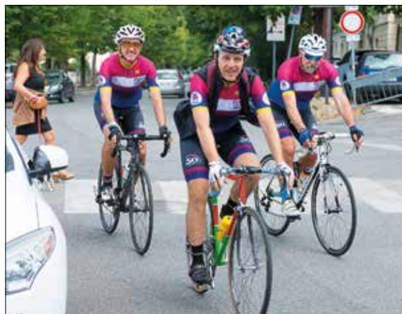
Partenza pedalata fra amici

gia) e tipo 2 girando per l'Italia e facendo informazione, ma anche partecipando ad eventi di pellegrinaggio (non ultimo quello ad Assisi o da Bologna fino alla Madonna del Ghisallo) e proprio quest'anno a un evento oltreoceano, in America, proprio per un progetto che aveva come principi la salute, la solidarietà, lo sport, la sicurezza stradale e la salvaguardia del creato.