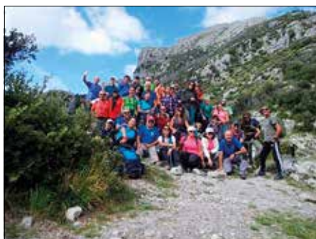
Il numeroso e vivace gruppo di soci, in cammino nel famoso Sentiero degli Dei - 24-25 Settembre 2022

re una bellissima foto di gruppo a suggello dell'iniziativa e del gemellaggio tra le varie sezioni CAI coinvolte. Il sentiero è poi ridisceso fino a raggiungere Nocelle, delizioso paesino che oltre ai suoi scorci di vicoli e paesaggi, nella sua piazzetta ha dato la possibilità di godere di una pausa meritata accompagnata dalla famosa limonata locale e da una vista mozzafiato sull'incantevole Positano. Da qui si è poi tornati indietro sul celeberrimo percorso della parte bassa del Sentiero degli Dei, per arrivare all'imbrunire a Bomerano e quindi al luogo di partenza dove, prima dei saluti e ringraziamenti, c'è stato uno scambio di gagliardetti sezionali tra i direttori di escursione. La sera i partecipanti della nostra sezione e sottosezione hanno consumato l'ottima cena locale e quindi per-