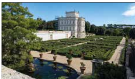
Gita a Villa Pamphili