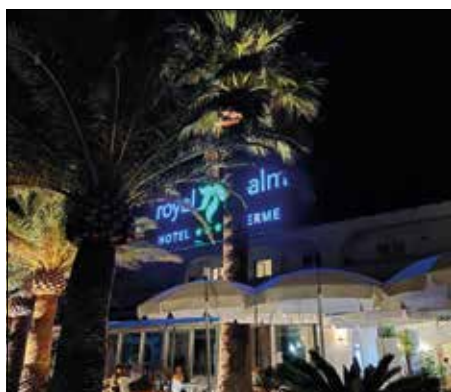
Gita a Pesaro