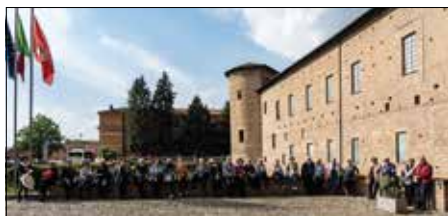
Pasqua a Piacenza e a Cremona