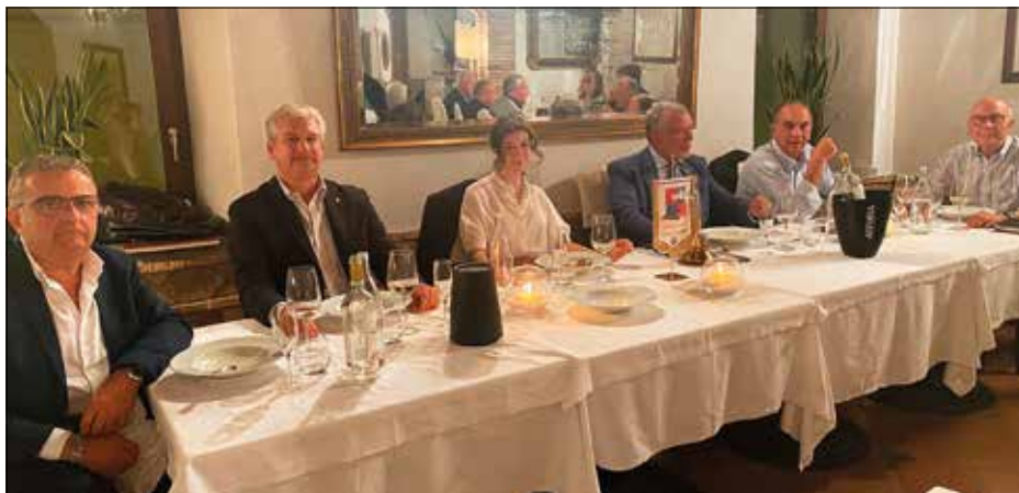
Un momento dell'assemblea

Si tratta di un programma complesso e impegnativo ma è costruito a misura delle grandi capacità realizzatrici del club, abituato a tener fede agli impegni che prende nei confronti della comunità.