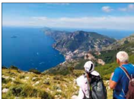
Una vista che riempie il cuore: la costiera sorrentina - 24-25 Settembre 2022

L'attesissimo WE sui Monti Lattari e il Parco Nazionale del Vesuvio è iniziato nella mattinata del 24 settembre con la partenza del pullman turistico che ha condotto il nutrito gruppo di partecipanti fino alla piazza principale di Agerola, luogo dell'appuntamento con gli amici e soci CAI di Castellammare e Cava. L'escursione è partita proprio da qui per inerparsi poco dopo sulle ripide scalinate che conducono all'inizio della parte alta del Sentiero degli Dei. Il percorso, da subito impegnativo, ha condotto gli oltre 50 soci sulla panoramica vetta del Monte Tre Calli, dal quale si è potuto ammirare un panorama mozzafiato della costiera. Dopo una breve pausa si è ripreso il cammino fino al Passo di Capomuro, nei pressi della roccia con una tipica conformazione a fungo. Qui i partecipanti hanno colto l'occasione per scatta-