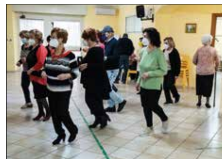
Conviviale e balli