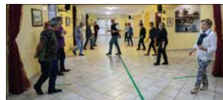
Lezione di ballo