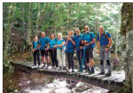
Tra i boschi incontaminati del Parco del Pollino - 8-11 Settembre 2022

gimento di 7 delle 10 vette sopra i 2000 m del parco. Il Parco del Pollino è diviso fra due regioni, Basilicata e Calabria, ed è formato da un'imponente struttura rocciosa calcarea/calcareo dolomitica a cavallo fra due mari, pertanto è naturale iniziare con un trekking all'Arco Magno (San Nicola Arcella - Cosenza) splendida struttura naturale sul mare cristallino della Calabria... e tuffarsi in quelle acque è un richiamo fortissimo. Salire dal mare verso la montagna è un viaggio nella storia e sulla strada per Viggianello ci fermiamo a visitare la grotta del Romito, sito della testimonianza della presenza dell'uomo preistorico risalente a circa 14.000 anni fa, con alcune sepolture e lo splendido graffito del bue primogenis. Secondo giorno si comincia con La Serra di Crispo che è la più settentrionale delle cime principali del Pollino; insieme alla Serra delle Ciavole forma una dorsale con orientamento N-S che è distaccata da quella principale, si parte dal Santuario della Madonna di Pollino, la Serra di Crispo può esse-