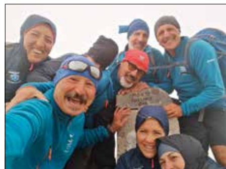
Arrivo in vetta al Monte Pollino, tra le nuvole e il vento - Parco del Pollino - 8-11 Settembre 2022

re considerata la più affascinante di queste: posta in un territorio incontaminato e poco frequentato, ospita sulla sua cresta S il cosiddetto "giardino degli dei", un rigoglioso boschetto di splendidi pini loricati, piante considerate quasi mitiche per la loro capacità di sopravvivere a quote superiori ai 1900-2000 m. Inoltre, dalla cima la vista è grandiosa: panoramica sulle altre grandi cime del Pollino e lo sguardo può spingersi dal Mar Tirreno al Mar Ionio. Terzo giorno la vetta più alta del Parco, la Serra del Dolcedorme, con partenza da Colle Impiso e giornata interminabile. Quarto e ultimo giorno la vetta che dà il nome al Parco: il Pollino nome che probabilmente deriva dal Latino "Pullus" giovane animale o "Monte di Apollo", giornate fantastiche, anche meteorologicamente parlando, ci hanno accompagnato in questa immersione di colori del Parco del Pollino, uno speciale ringraziamento a Domenico e sua Moglie per l'accoglienza con la quale gestiscono il B&B a Viggianello, naturalmente grazie agli amici... soci.... partecipanti che hanno contribuito con il loro impegno alla riuscita delle escursioni, grazie a Marcello per il supporto organizzativo. Buona montagna a tutti.