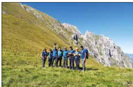
Belvedere naturale sul monte Camicia, sui rilievi Abruzzesi e sul mare Adriatico - Escursione al Monte Coppe - 18 Settembre 2022