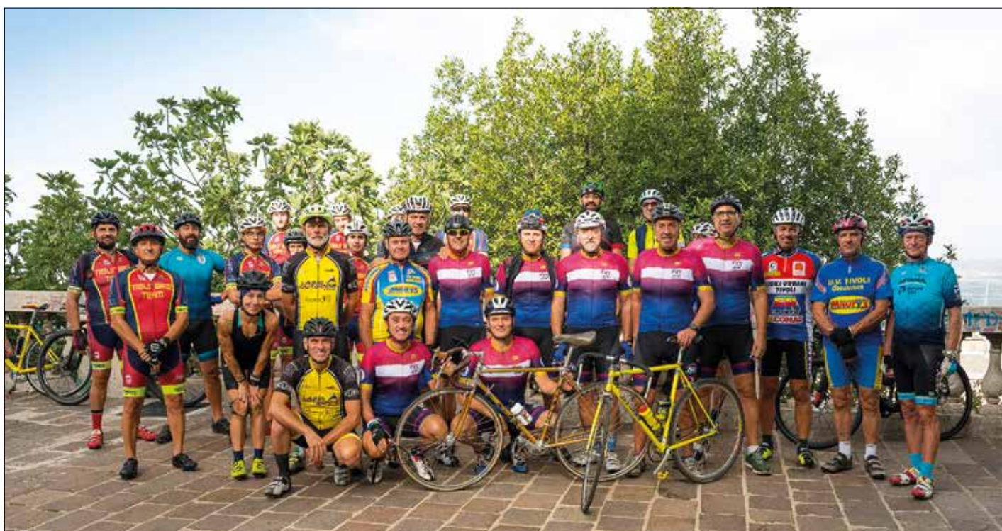
Gruppo amici che hanno aderito alla pedalata