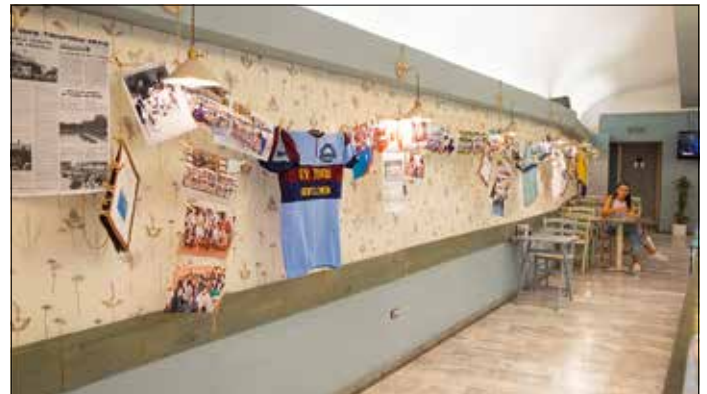
Mostra fotografica vecchie maglie