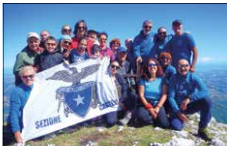
CAI Tivoli e CAI Castelli, tutti insieme appasionatamente in vetta al monte Coppe - 18 Settembre 2022