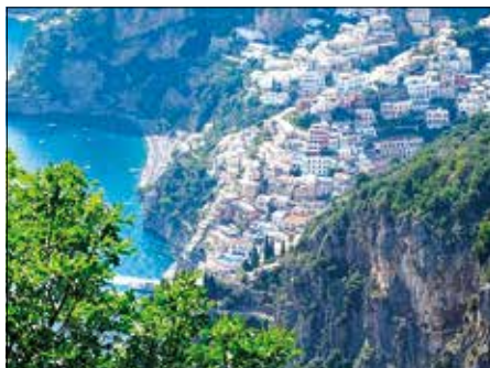
L'inconfondibile vista di Positano, dal Sentiero degli Dei - 24-25 Settembre 2022

nottato nella struttura di un agriturismo di Agerola. Il giorno dopo il gruppo, purtroppo già a conoscenza dal giorno precedente delle proibitive e avverse condizioni meteo sulla zona, ha forzatamente dovuto rinunciare alla programmata escursione sul Gran Cono del Vesuvio e nella Valle dell'Inferno. Ma prima di ritornare sulla strada del ritorno c'è stato un incontro con alcuni soci dei CAI del territorio che si erano oltremodo prodigati per l'organizzazione e la buona riuscita dell'escursione. Infine, dopo i dovuti ringraziamenti per la disponibilità e la squisita accoglienza ricevuta dalle sezioni CAI di Castellammare e Cava, i responsabili dell'iniziativa intersezionale si sono salutati con la volontà di riprovare entro poco tempo a effettuare la mancata escursione sul Vesuvio e, in particolare, a mantenere i contatti in un'ottica di scambio di visite finalizzato alla condivisione e alla conoscenza dei rispettivi territori montani di appartenenza.