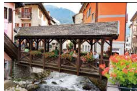
Gita ad Aprica