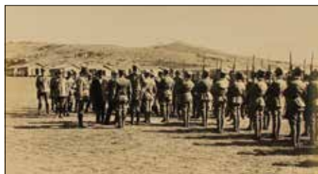
Giuramento aspiranti piloti

Giuramento del Corso Aspiranti Ufficiali Piloti.