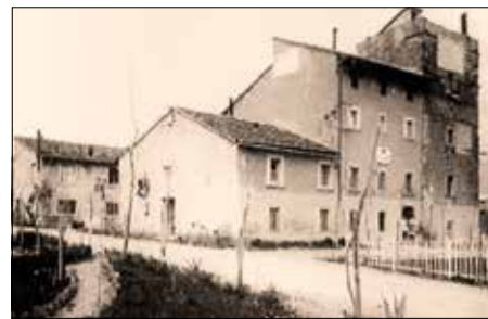
Il Casale dei Prati

Il casale, risalente al XVII secolo, già dimora della famiglia Filippini di Montecelio, divenne in seguito, al momento della realizzazione del Campo, proprietà Comunale. Gli ingressi, collegati da un viale principale in terra battuta, furono posti: