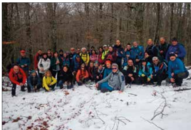
Foto di gruppo sul monte Peccia, escursione del 3 marzo 2024

Sabato 9 marzo, seppur accompagnati da una debole ma incessante pioggia, si è svolta la suggestiva escursione nella forra del Biedano, tra i Comuni di Bletera e Barbarano Romano, nel Viterbese, una proposta molto originale all'in-