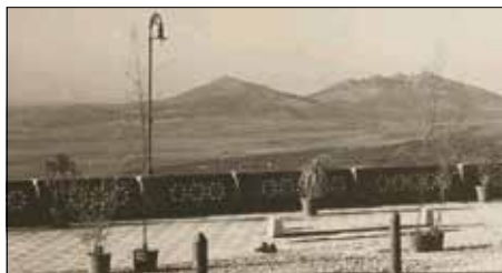
Piana di Montecelio a fine 1800