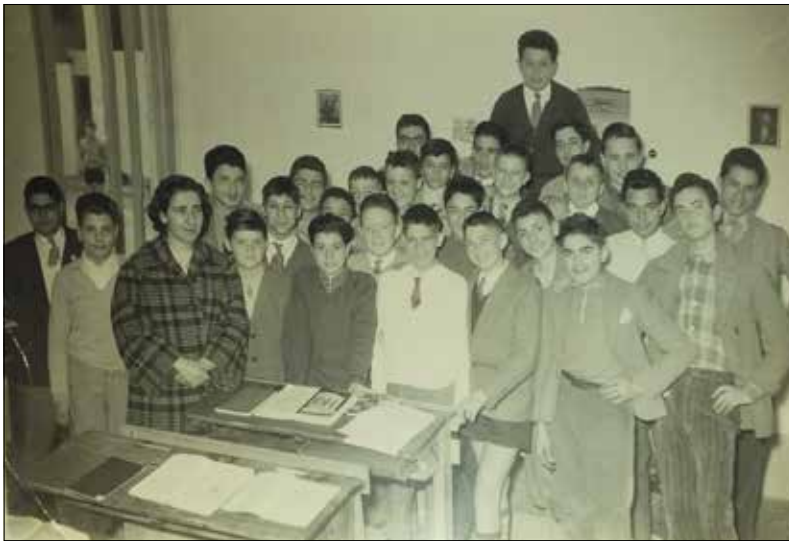
Tivoli, 3 a media - Sezione F - anno 1958-1959 ALBIO TIBULLO