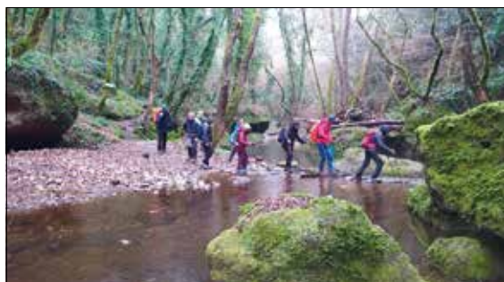
Uno dei tanti guadi del Biedano, escursione del 9 marzo 2024