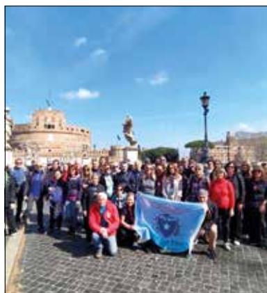
Trekking urbano "Eretici indecenti", sabato 23 marzo 2024