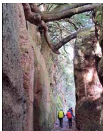
Via cava etrusca di Barbarano Romano, escursione del 9 marzo 2024

Come sempre, concludiamo il nostro contributo sul Notiziario Tiburtino , con il programma dei prossimi mesi, mai così ricchi di iniziative pluri-giornaliere, con varie destinazioni, durata e difficoltà: dall'Isola del Giglio, al monte Grappa, dal cammino di San Benedetto alle Dolomiti Lucane.