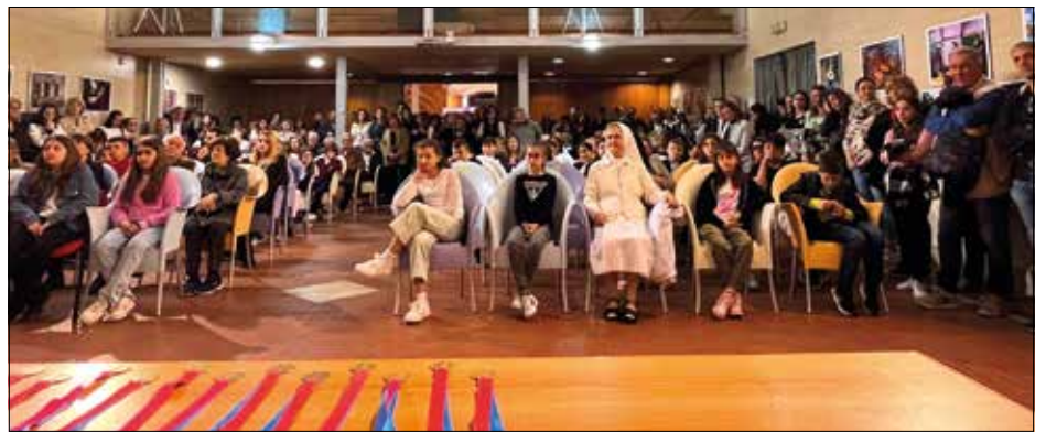
Particolare della Sala delle Scuderie Estensi