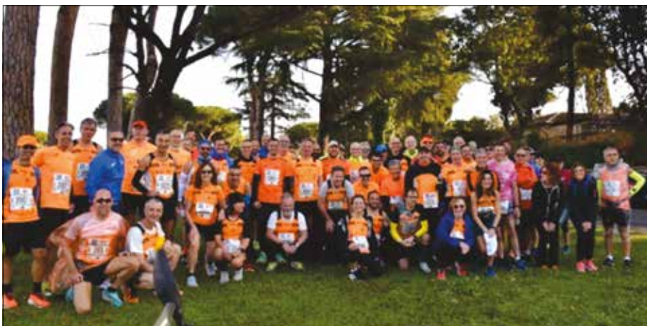
Gli Orange alla Roma-Ostia 2024