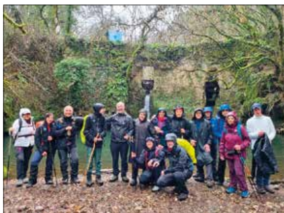
Foto di gruppo e sullo sfondo una delle mole sul Biedano, escursione del 9 marzo 2024

sperienza, mettendo in evidenza la connessione con l'ambiente, per comprendere meglio il cammino lento e faticoso del viandante etrusco, fatto di storia, natura e mistero. Grazie al CAI di Tivoli e agli organizzatori dell'esperienza!».