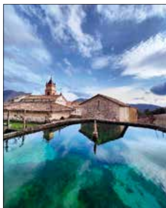
Certosa di Trisulti, escursione del 3 marzo 2024