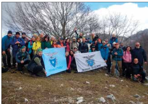
Escursione intersezionale CAI Tivoli e CAI Alatri, 3 marzo 2024