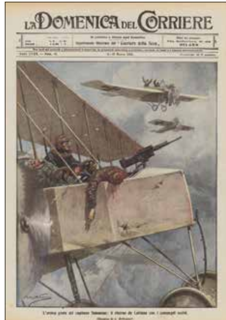
Domenica del Corriere - N.10 - Illustrazione di Achille Beltrame

Nel combattimento perirono sia lui che Bailo, mentre Salomone gravemente ferito riuscì a effettuare un atterraggio di emergenza sul campo d'aviazione di Gonnars. Entrambi ricevettero, alla memoria, Medaglia d'Argento al VM.